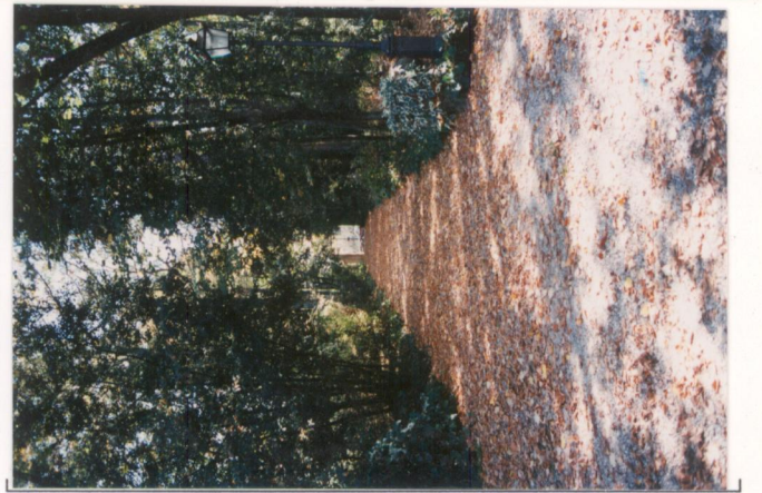
p.v. N. 4