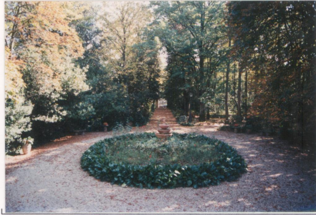
p.v. N. 3