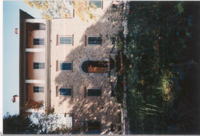
p.v. N. 2