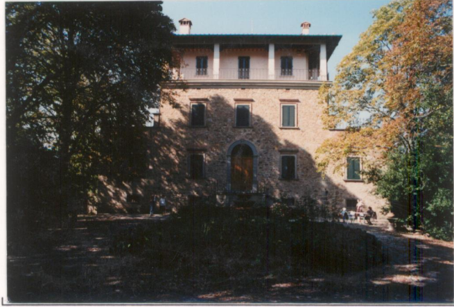
p.v. N. 1