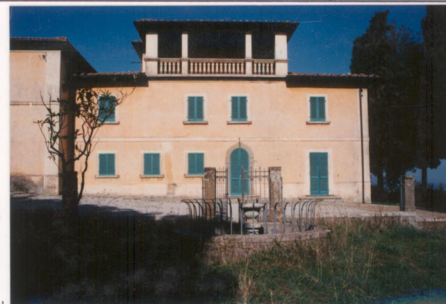
Film 655 Foto 3A.....