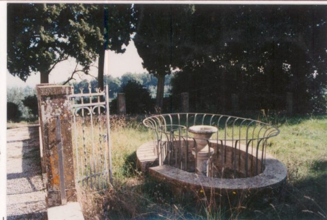
Film 655 Foto 2A.....