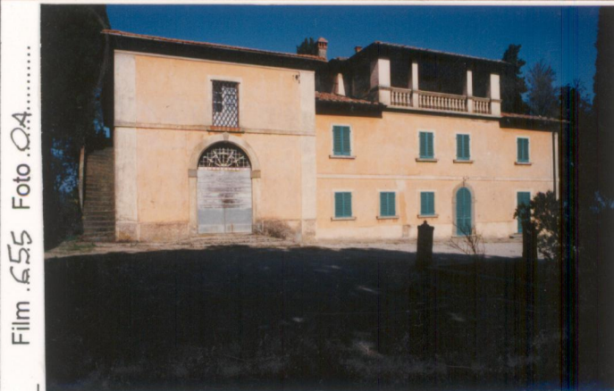
Film 655 Foto 0A.....