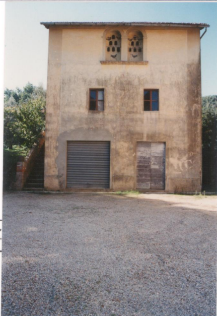
p.v. N. 5