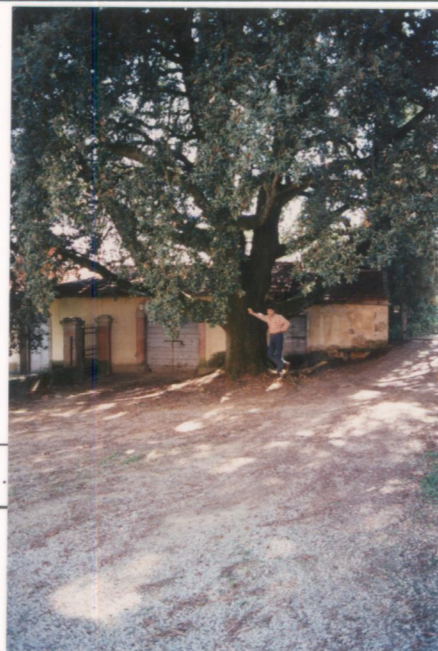
p.v. N. 6