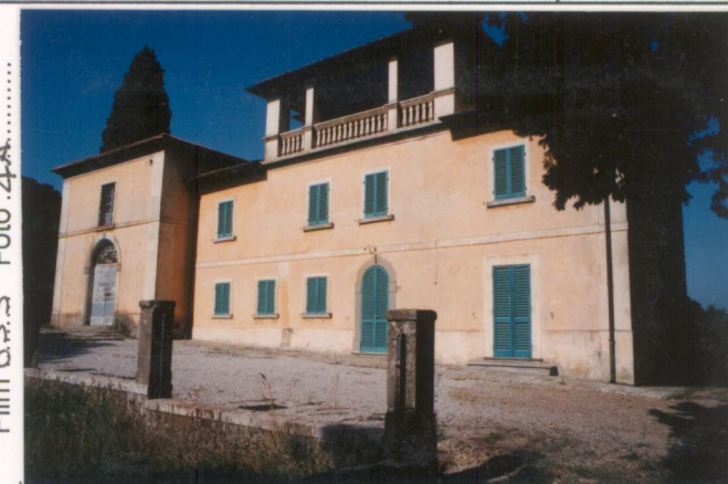
Film 655 Foto 4A.....