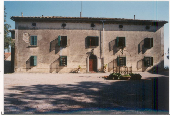
p.v. N. 1