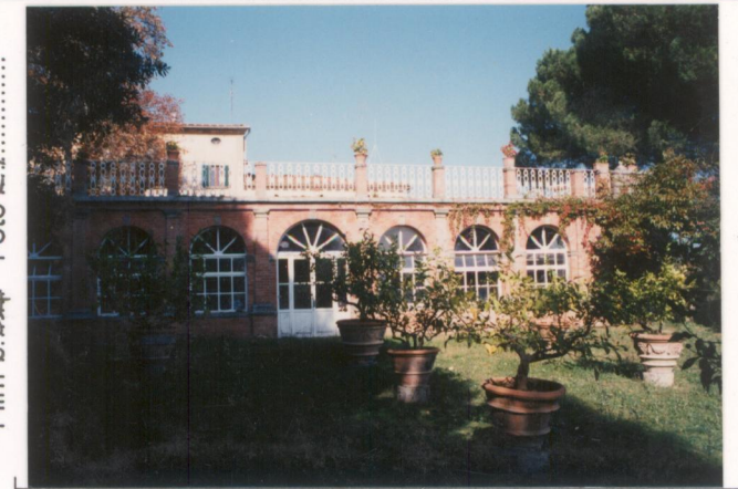
p.v. N. 4: Limonaia