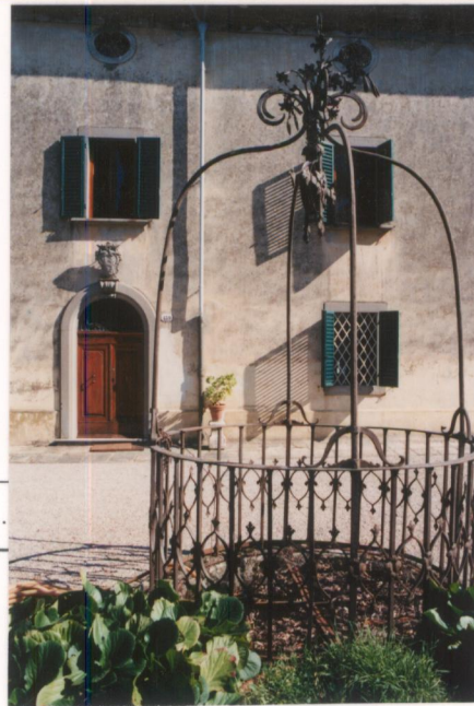
p.v. N. 7.....