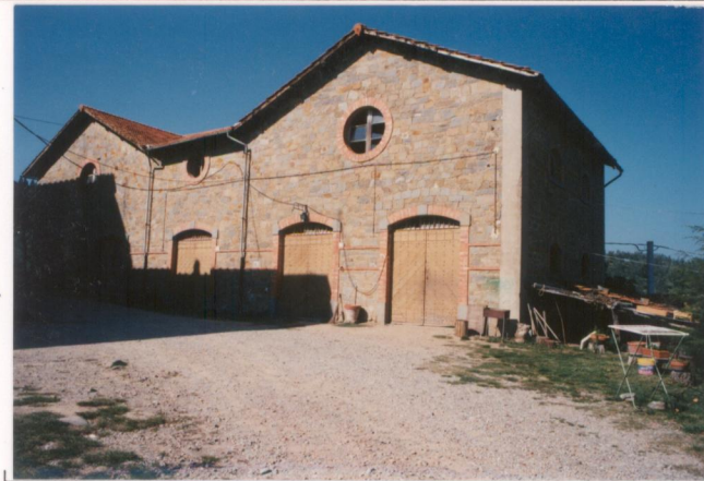
p.v. N. 6.....