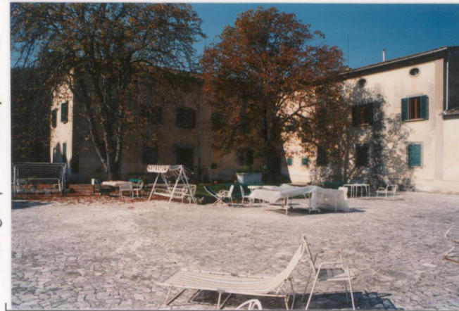
p.v. N. 3