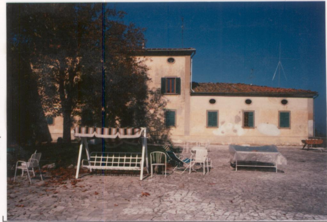
p.v. N. 2