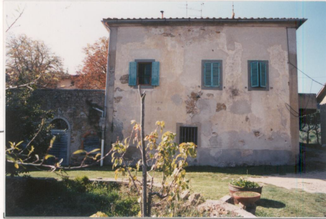
p.v. N. 5.....