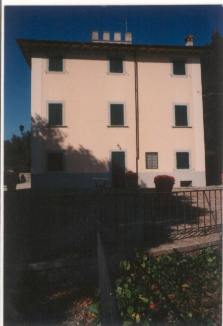
N° 9 Film : 654 Foto : 19