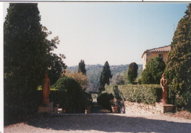
Film 654 Foto 15