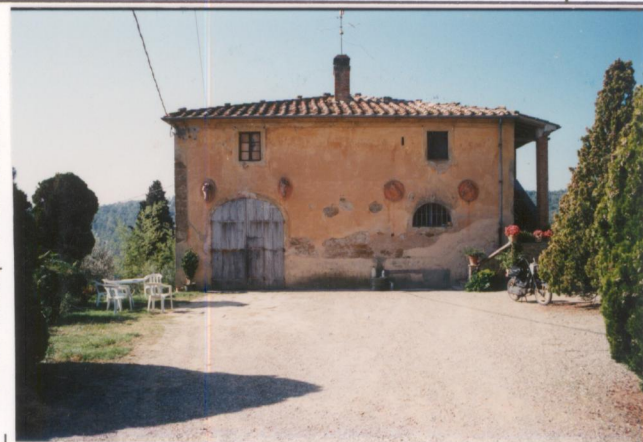
Film 654 Foto 16