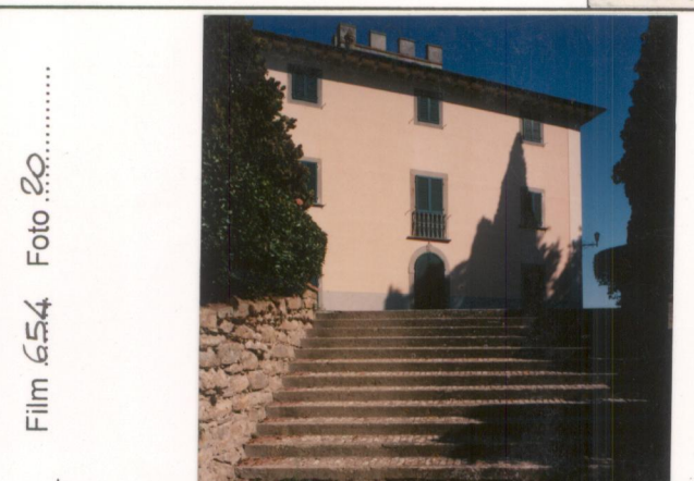
Film 654 Foto 20