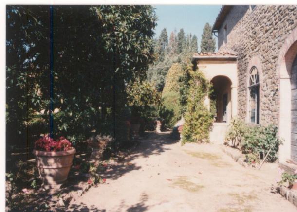
N° 10 Film : 654 Foto : 14