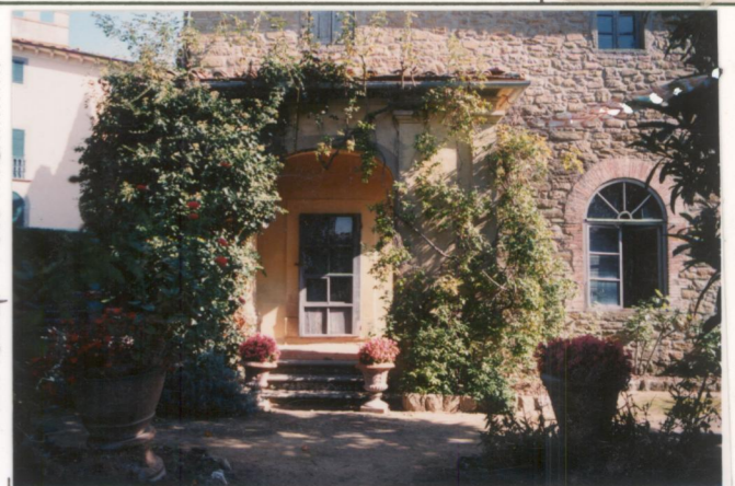
p.v. N. 4