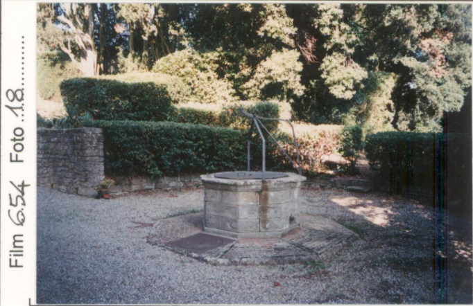
Film 654 Foto 18