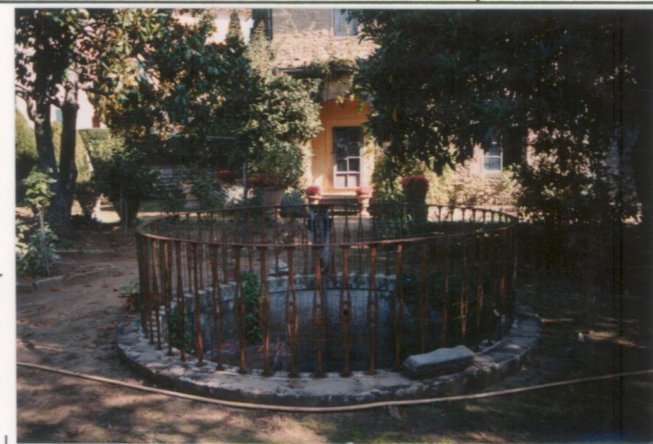
p.v. N. 3