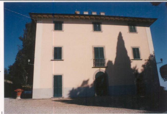
p.v. N. 2