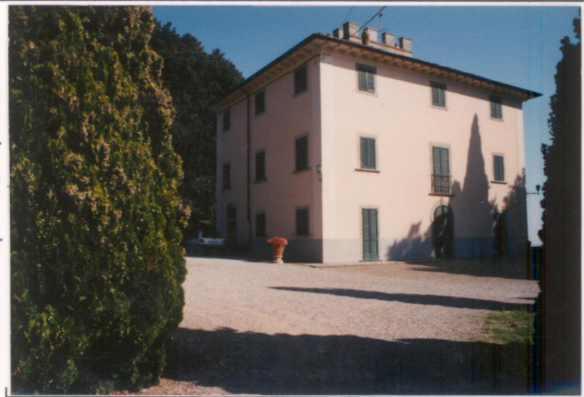
p.v. N. 1