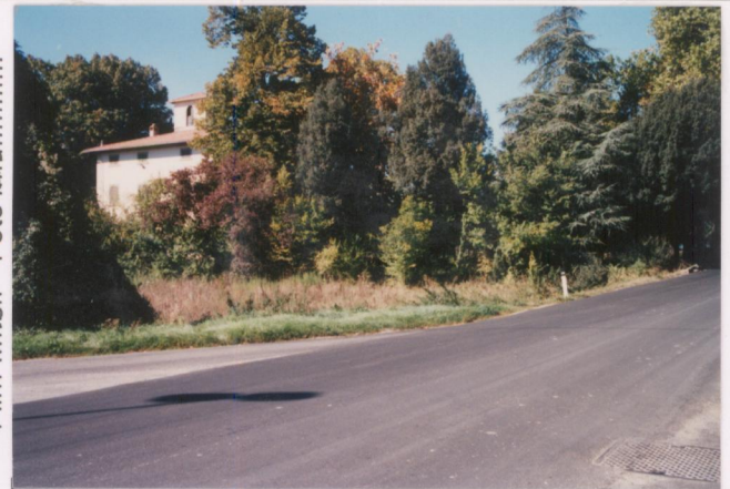
Film 648. Foto 29.....