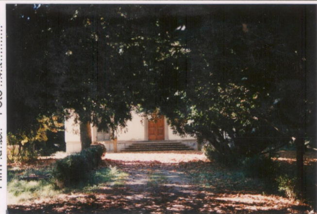
Film 648. Foto 51.....