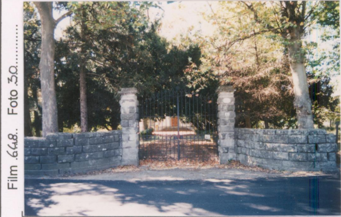
Film 648. Foto 50.....