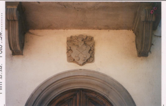
Film 648. Foto 53.....