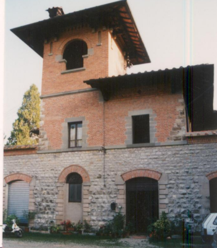
p.v. N. ....