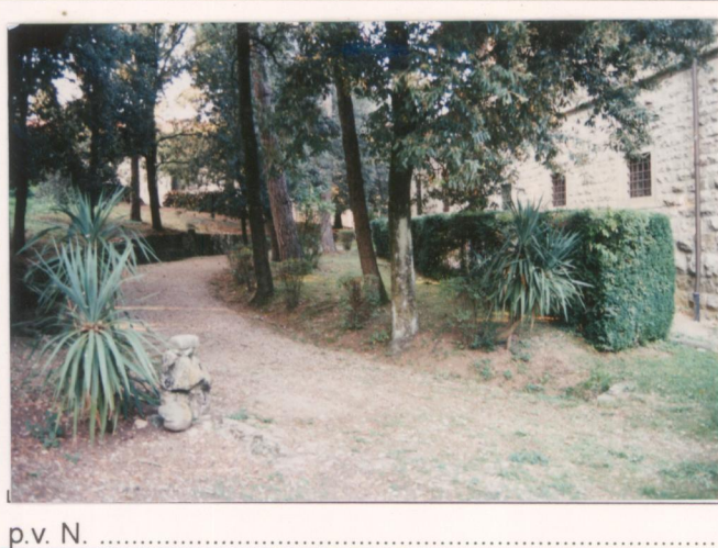
p.v. N. ....