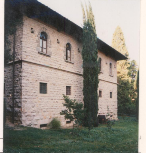
p.v. N. ....