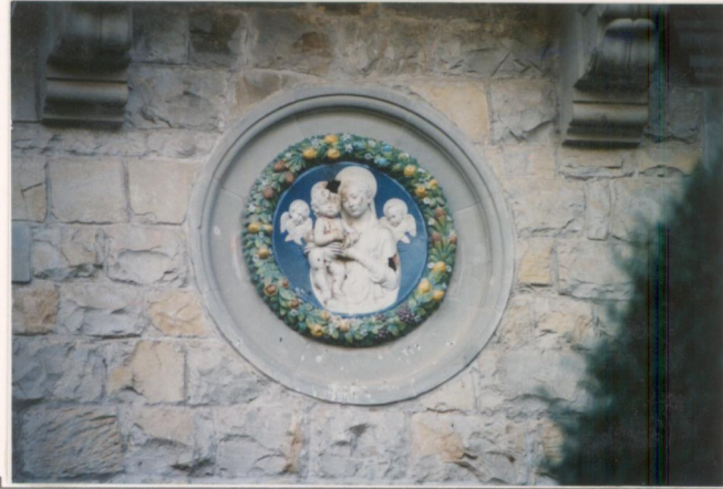
p.v. N. ..Mazoliche poste sulla facciata dell'edificio principale.....