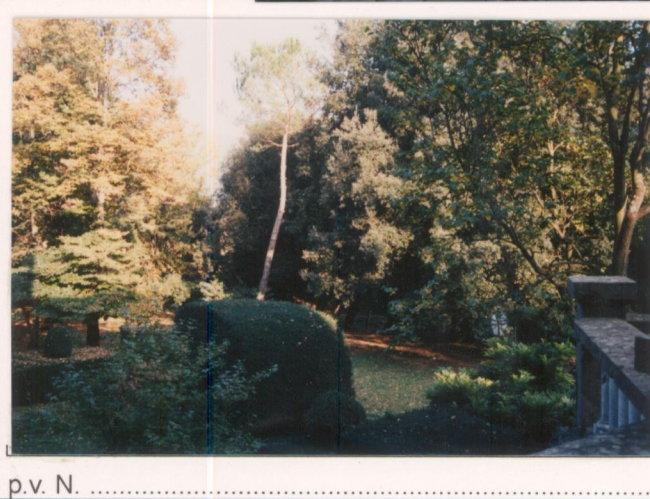
p.v. N. ....