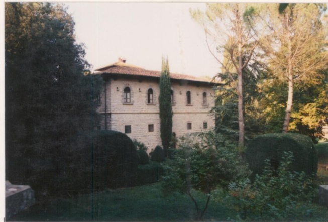
p.v. N. ....