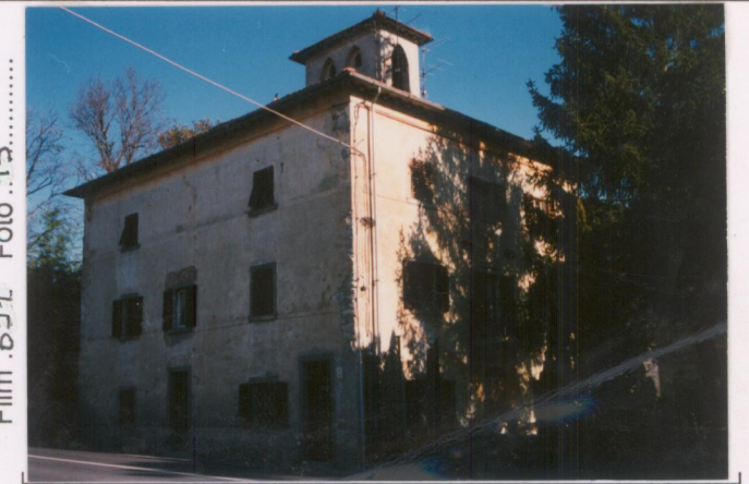
Film 691. Foto .15.