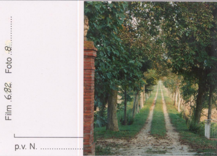
Film .682 Foto .8