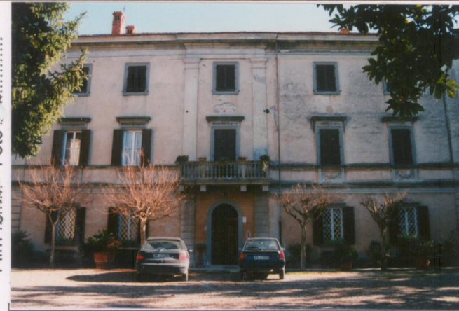
Film 691. Foto .16.