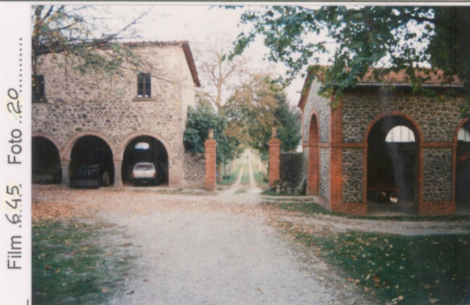
Film .645 Foto .20