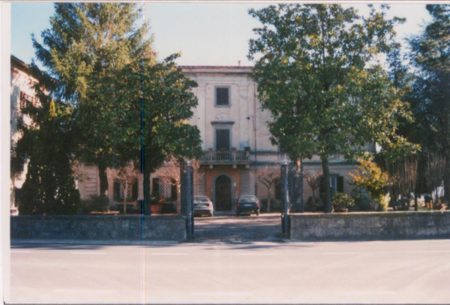
Film 691. Foto .14.