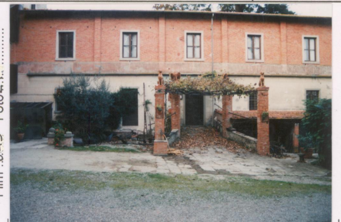
Film .645 Foto 2.1