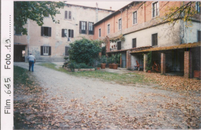
Film .645 Foto .1.3