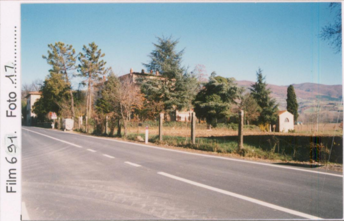
Film 691. Foto .17.