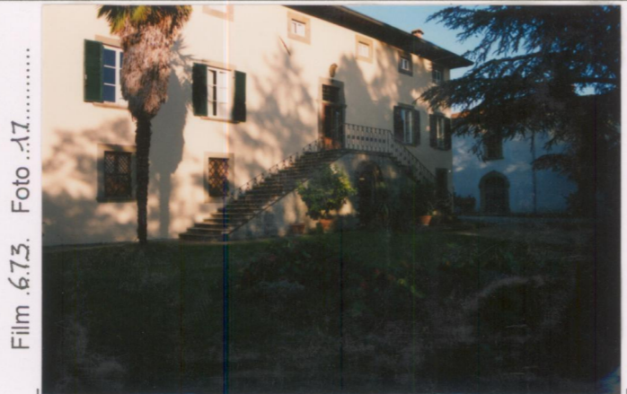
Film 6.73. Foto 17. .... p.v. N. ....