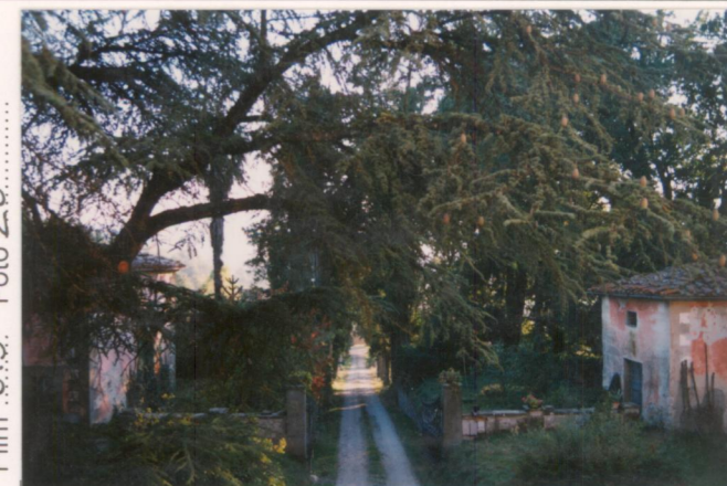
Film .673. Foto 29.