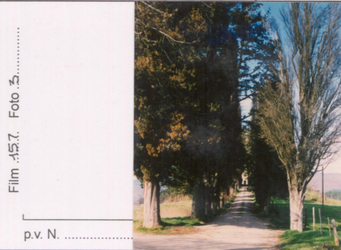
Film .15.7. Foto .3.....