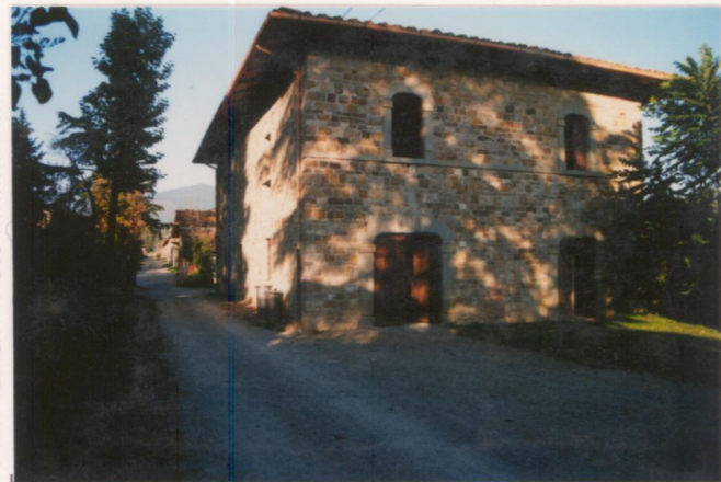
Film .673. Foto .19.