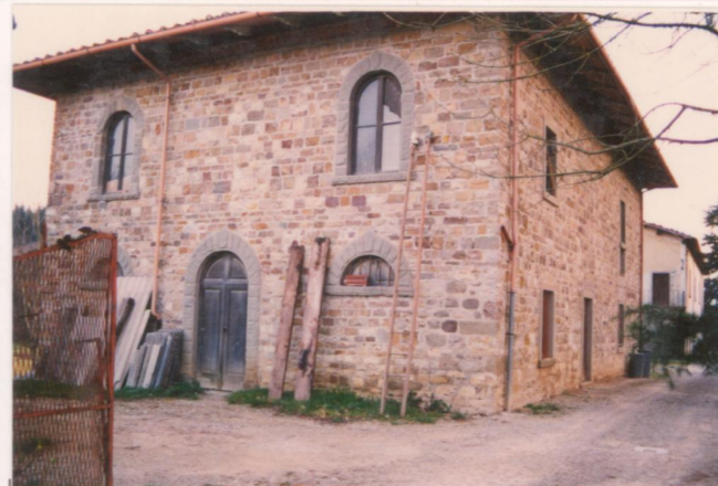
Film .157. Foto .33.