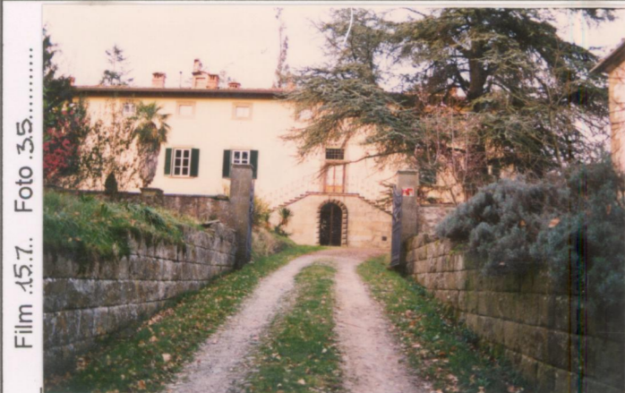
Film 15.7. Foto 35. .... p.v. N. ....