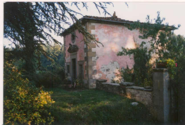
Film .673. Foto .18.