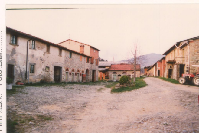
Film .157. Foto .32.