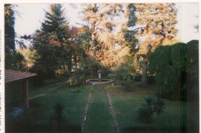
Film .673. Foto .21.