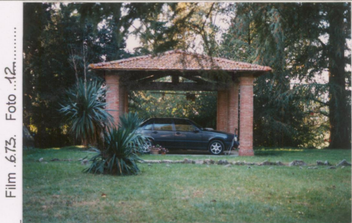
Film 6.73. Foto 12. .... p.v. N. Tettola.com. balauca. marena