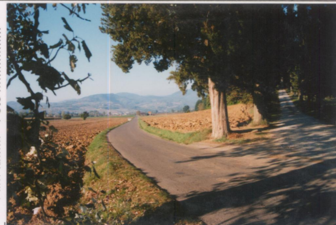
Film .6.7.3. Foto .8.....