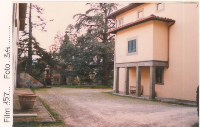
Film .157. Foto .34.