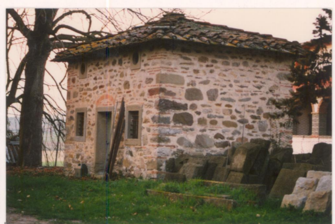
Film .156. Foto .31.