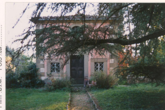
Film .673. Foto .15.