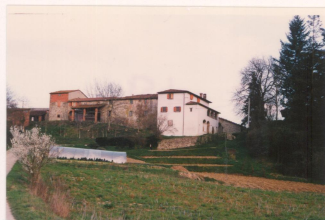
Film .157. Foto .30.