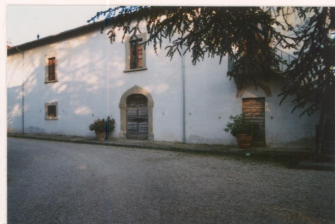
Film .673. Foto .14.