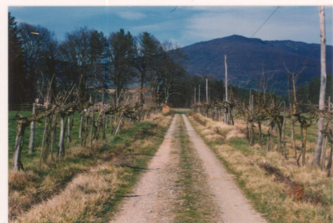
Film .157. Foto .5.