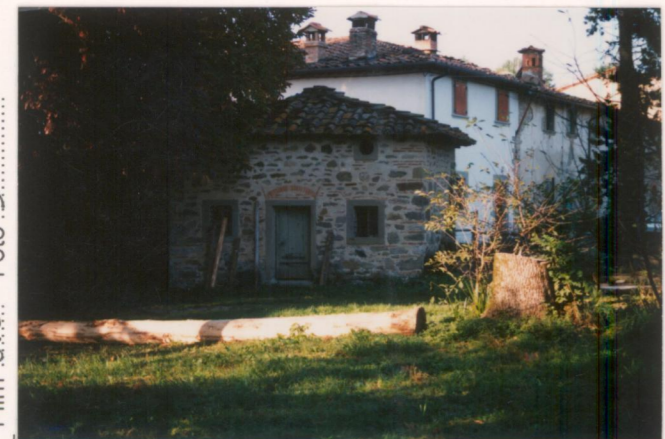
Film .673. Foto .5.