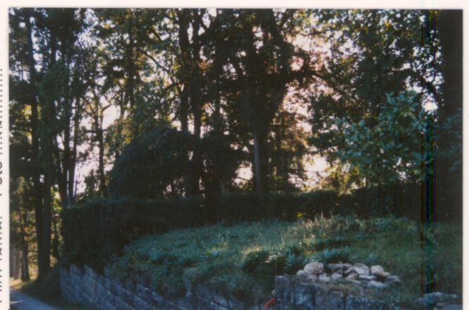
Film .673. Foto .13.