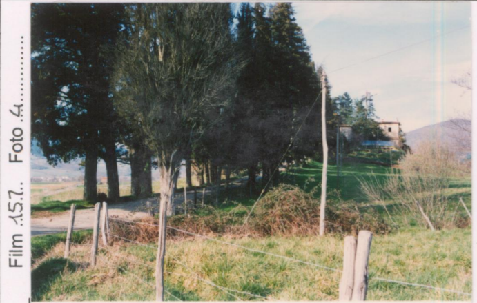
Film .15.7. Foto .4.....