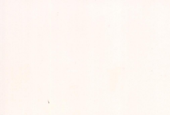
Film ..... Foto .....