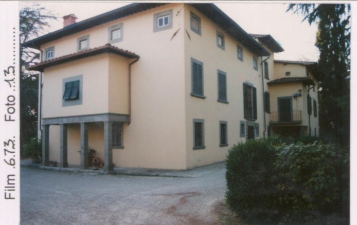
Film 6.73. Foto 13. .... p.v. N. ....