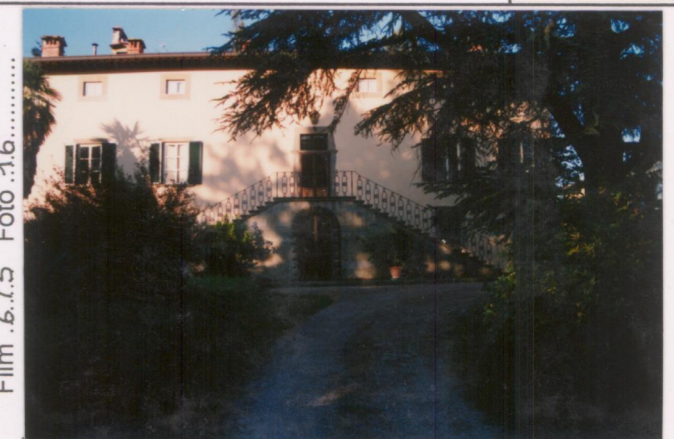
Film .6.7.3. Foto .16.....