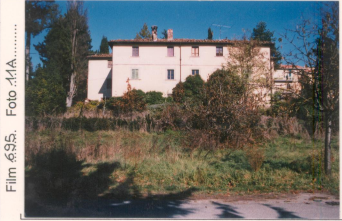
Film 695. Foto 11A