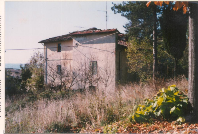
Film 695. Foto 14A