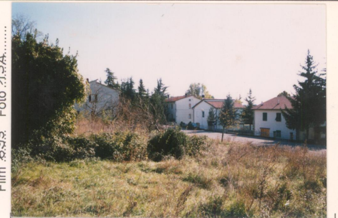
Film 695. Foto 13A