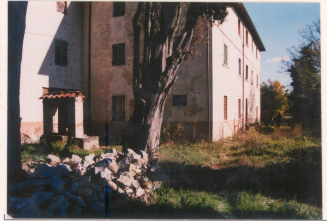
Film 695. Foto 12A