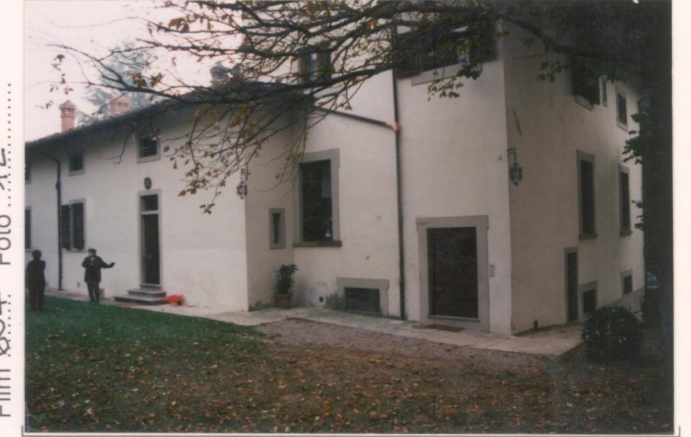
Film 694. Foto 12