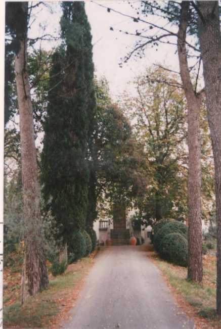
p.v. N. 1