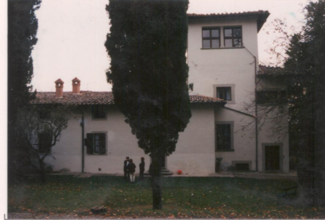
Film 694. Foto 13