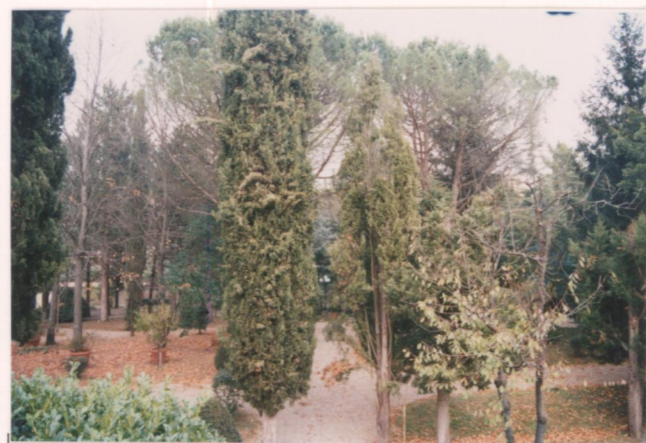
Film 694. Foto 10