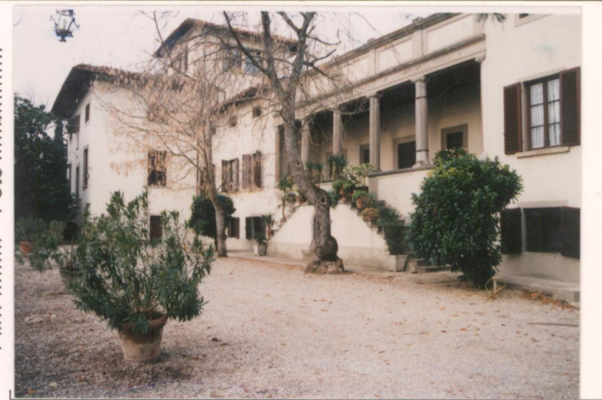
p.v. N. 4 Il fronte sud-ovest con il loggiato di impianto neoclassico.