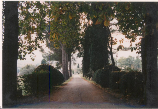
p.v. N. 2 Il viale di accesso