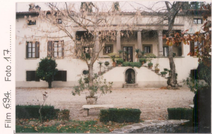
Film 694. Foto 17