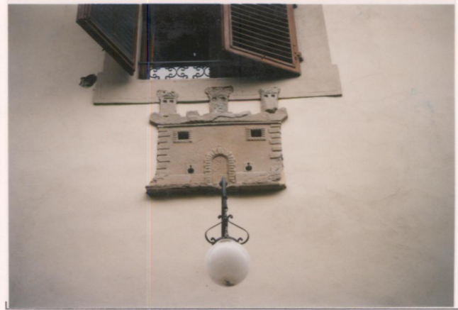
Film 694. Foto 19