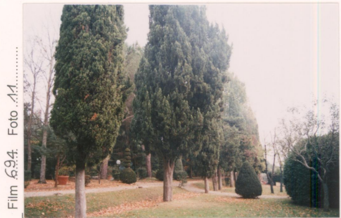
Film 694. Foto 11