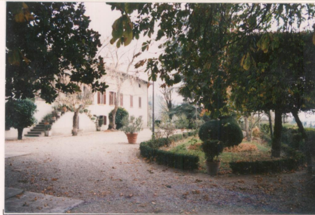
p.v. N. 3