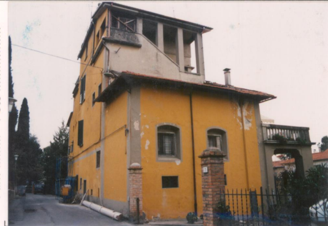
Film 694 Foto 28