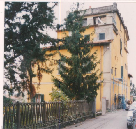
Film 694 Foto 27