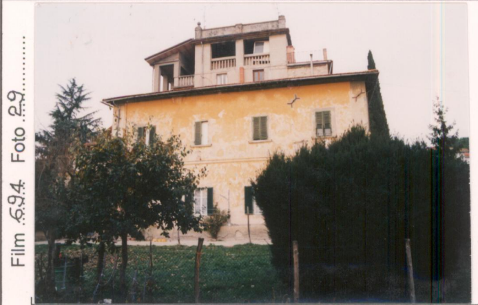
Film 694 Foto 29