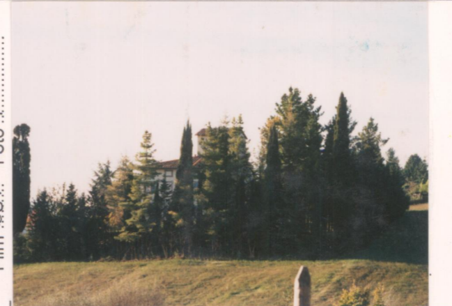
Film 681. Foto 7