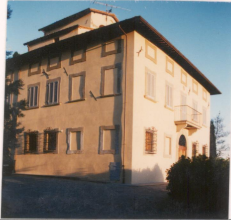
p.v. N. 5