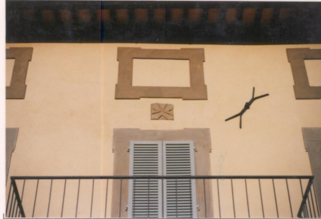
p.v. N. 6