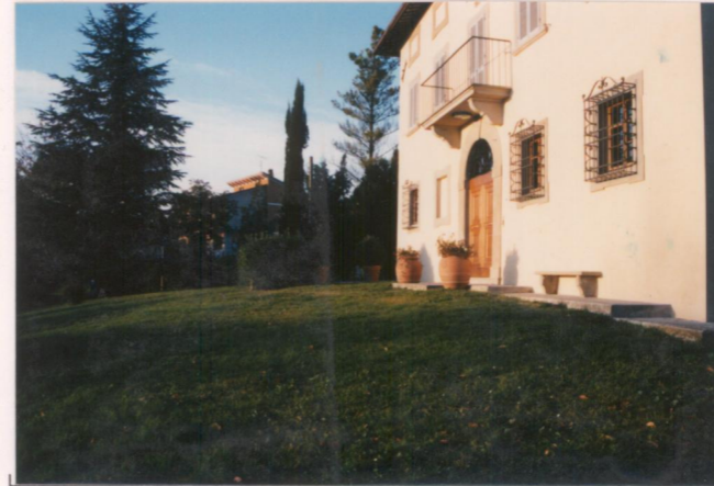
p.v. N. 7