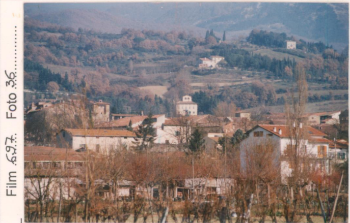
Film 687. Foto 36