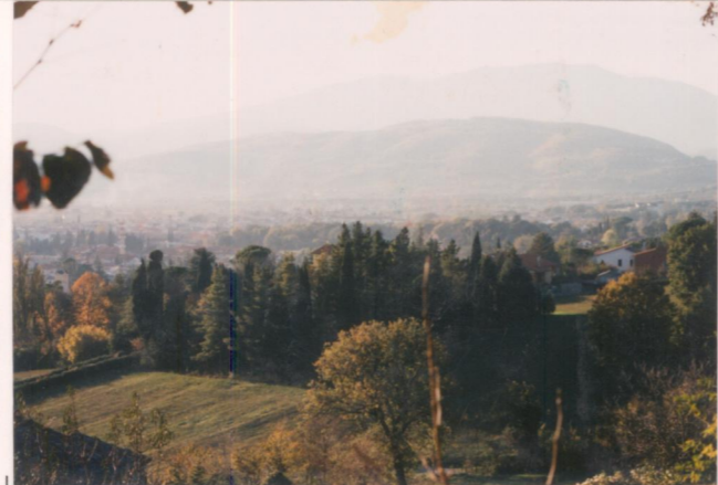
Film 681. Foto 6