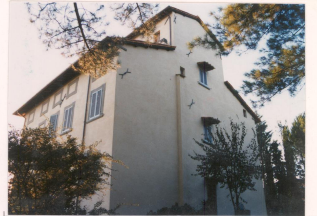
p.v. N. 8