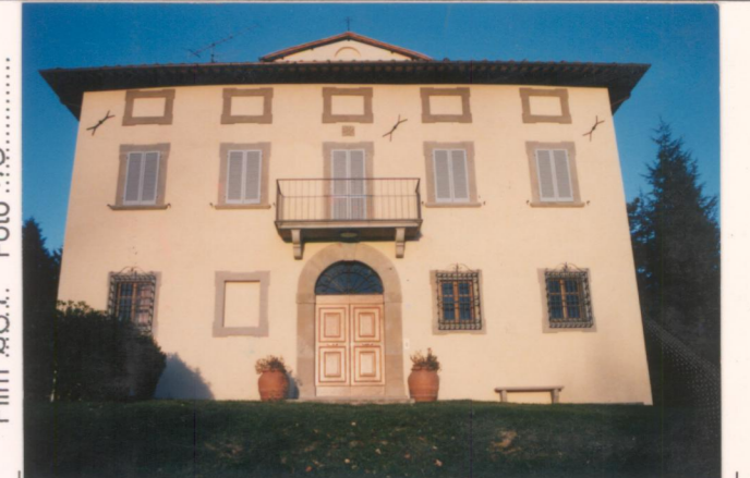
Film 681. Foto 10