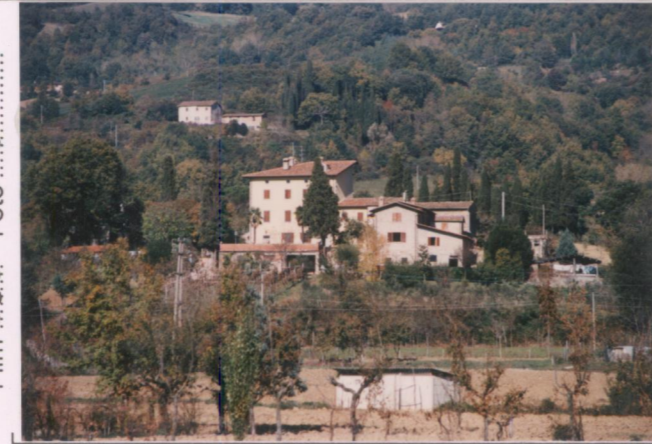
p.v. N. 2. Idem