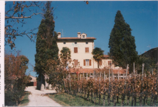
p.v. N. 3