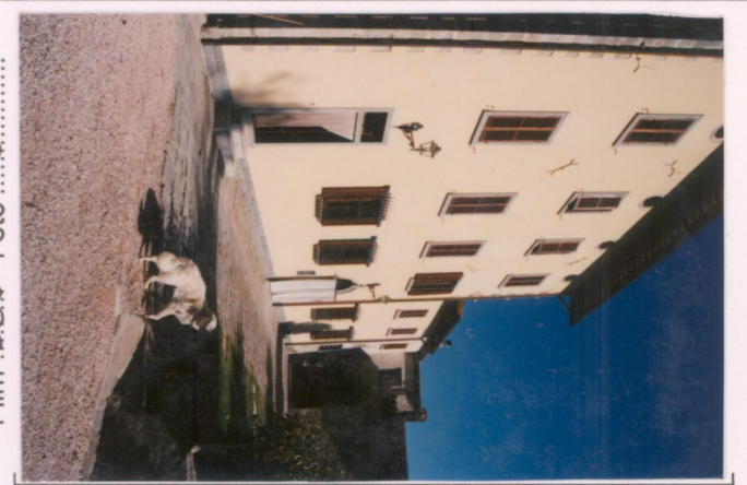
p.v. N. 4