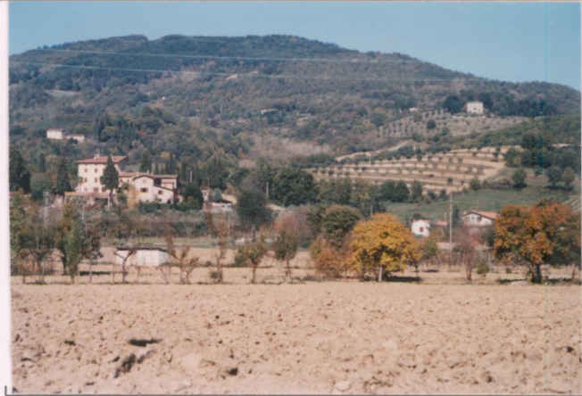
p.v. N. 1. Vista della strada Tiberina 3 bis. In alto a destra villa Irma