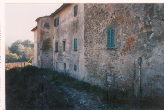
p.v. N.7 La pergola che giunge al fiume