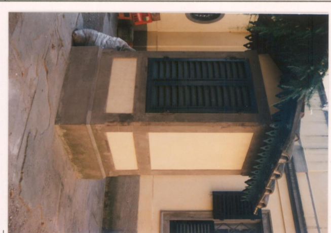
p.v. N. 15. Il pozzo