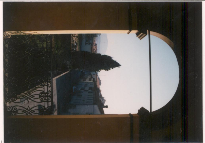
p.v. N. 13. Vista verso via Anconetana dalla torretta