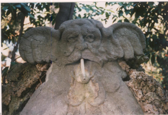
p.v. N. 10