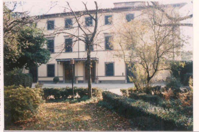
p.v. N. 4