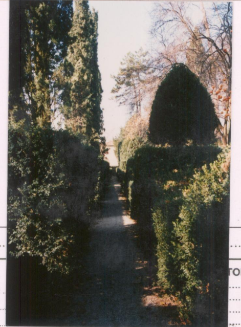
p.v. N. 8.....