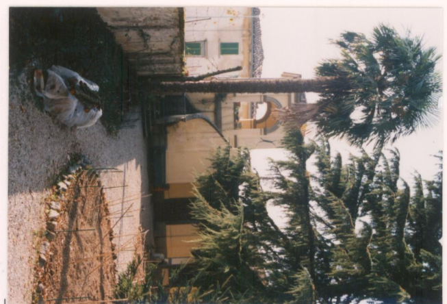
p.v. N. 11. La torretta sul muro di cinta dell'interno