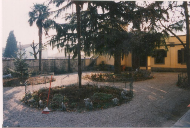
p.v. N. 3. Il giardinetto a est