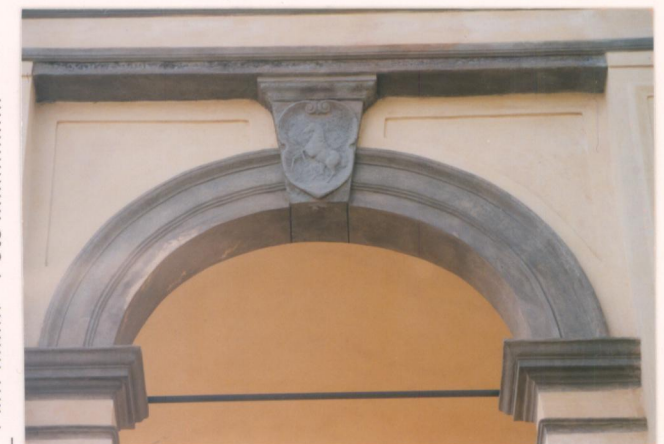
p.v. N. 12. Particolare della torretta