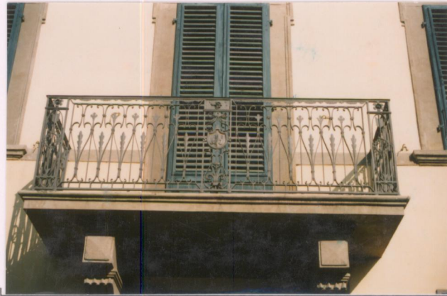
p.v. N. 6... Particolare del fronte su strada.....