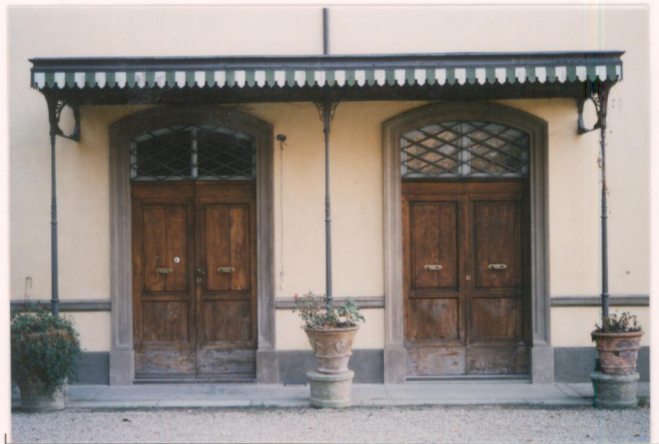
p.v. N. 5. La tettoia in ferro ottocentesca