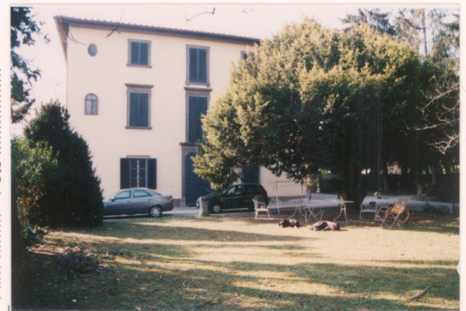
p.v. N. 8