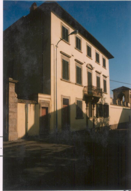
p.v. N. 5.....