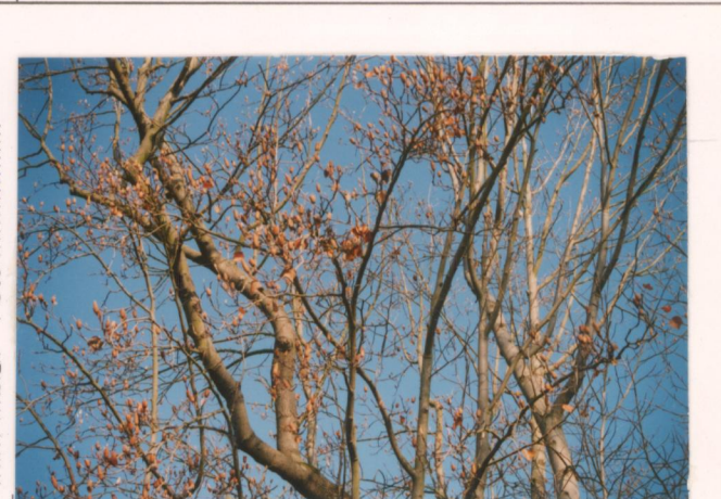
p.v. N. 16. L'albero del tulipano