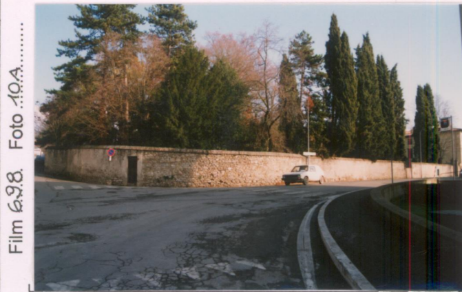
Film 6.98. Foto 10.A.....