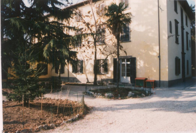
p.v. N. 7