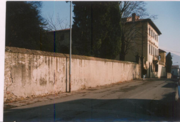
Film 6.98. Foto 12.A.....