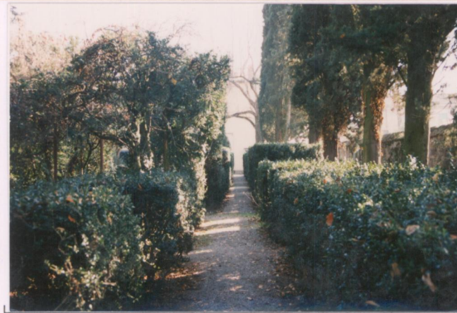
p.v. N. 7.....