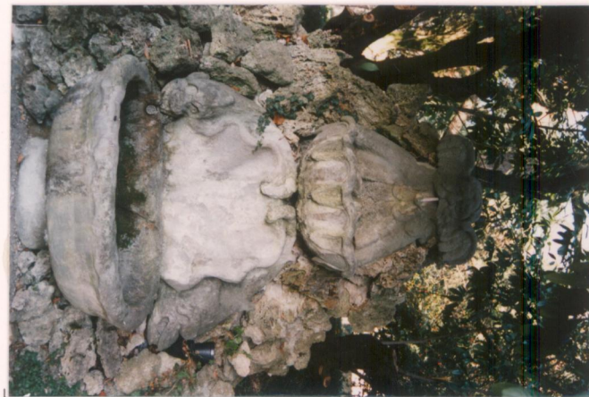
p.v. N. 9