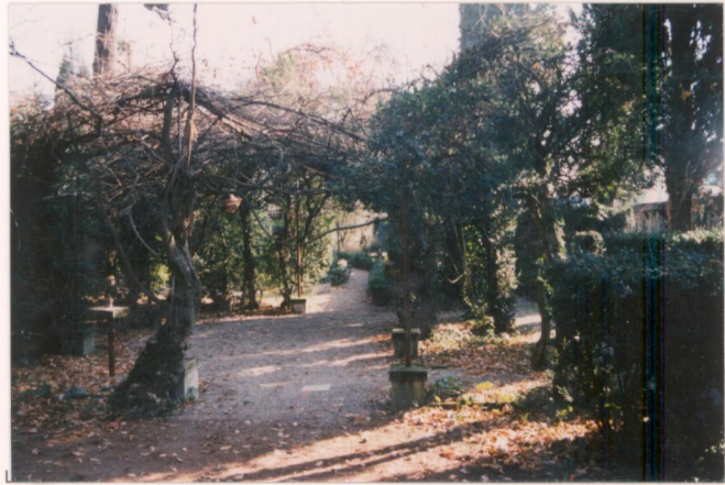
p.v. N. 1. La pergola