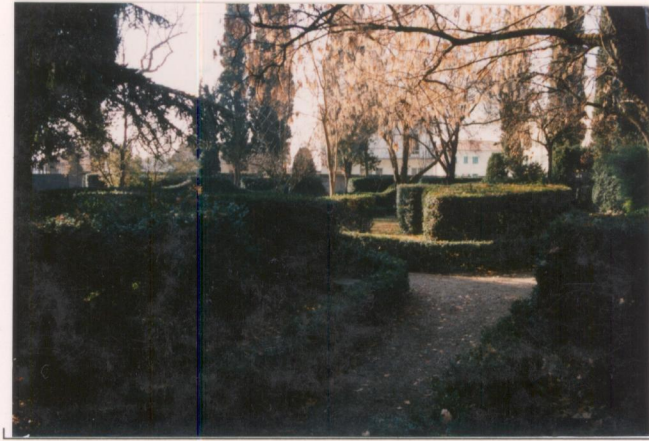
p.v. N. 2. Il giardino formale