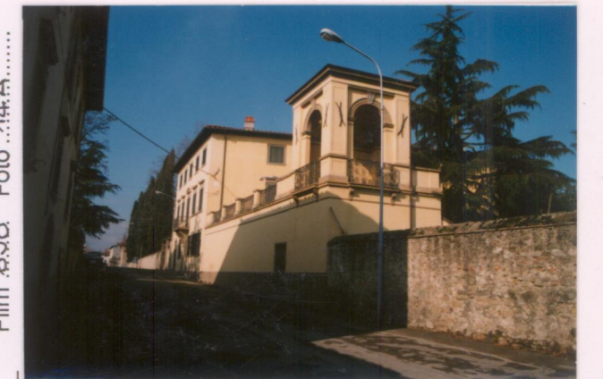
Film 6.98. Foto 14.A.....