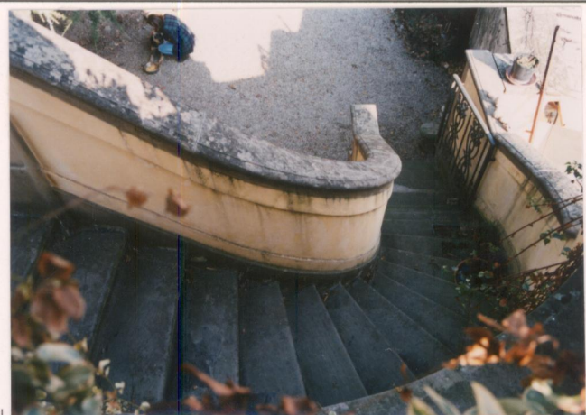
p.v. N. 14. Le scale di accesso