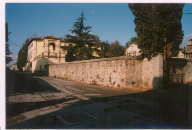
Film 6.98. Foto 15.A.....