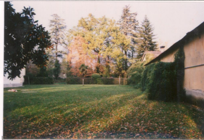
p.v. N. 7.....