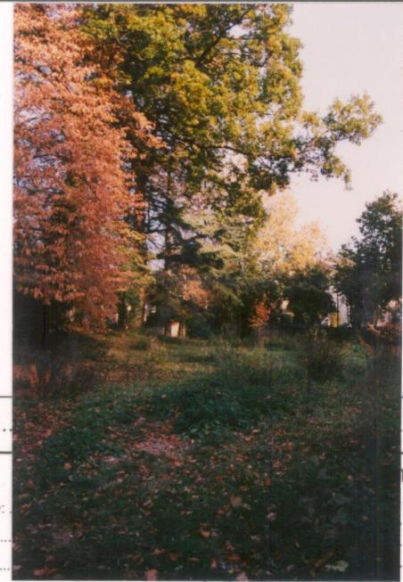
p.v. N. 8.....