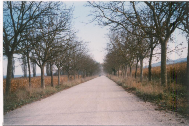
p.v. N. 1. Il viale di ingresso con alberi di noce alternati a Ciliegi