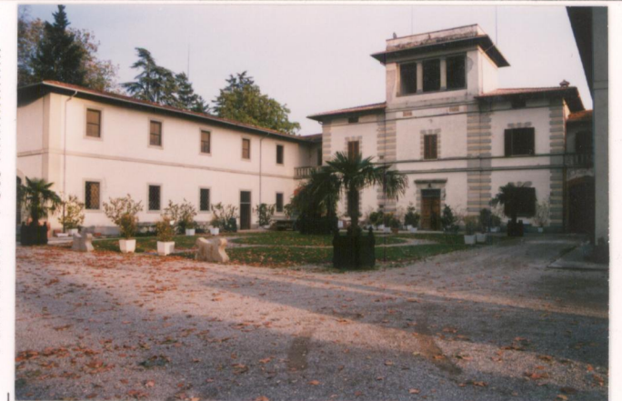
p.v. N. 4 La villa con l'ala destra adibita a tempo a fienili e granai