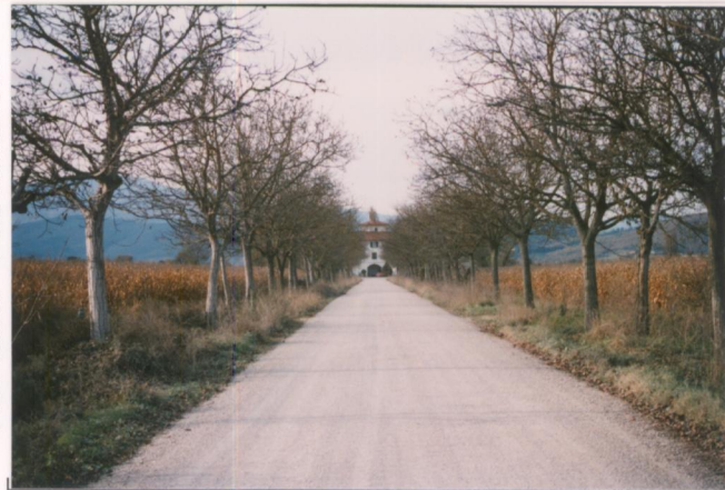
p.v. N. 2