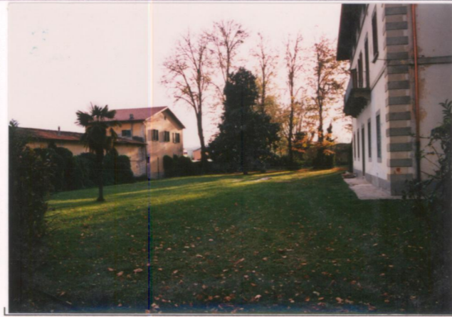
p.v. N. 6.....