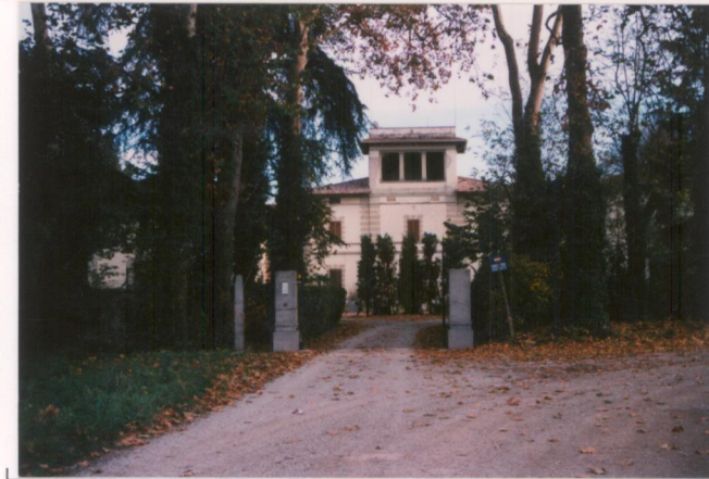
p.v. N. 3