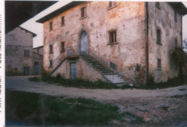
p.v. N. 3