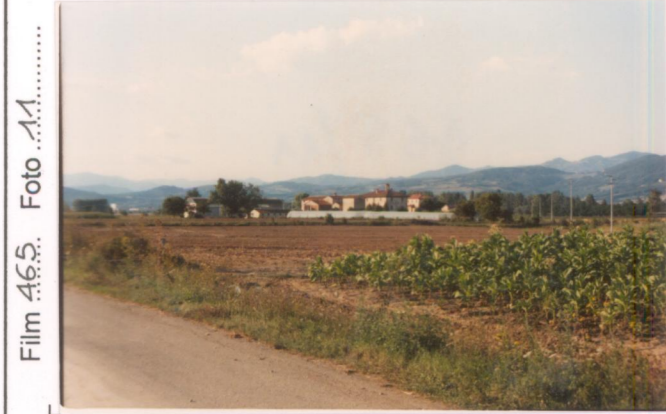
p.v. N. 1. Vista da sud-est