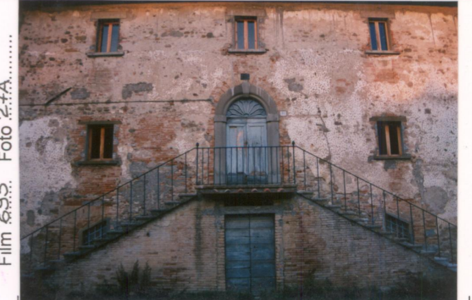
p.v. N. 4