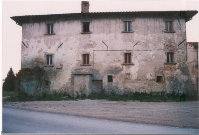
p.v. N. 5 Il fronte della casa padronale su strada