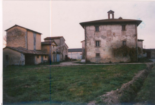
p.v. N. 2