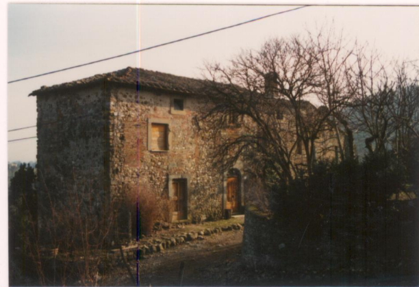
p.v. N.2 Il fronte ovest.....