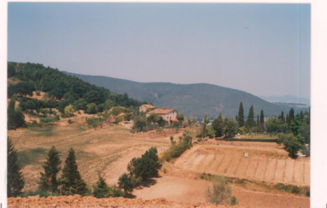
p.v. N.1... vista da sud-est.....