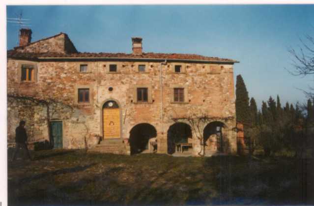
p.v. N.3... Il fronte sud.....