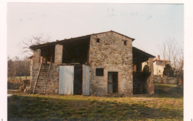
p.v. N.4 L'annesso (seccatoio + stalletta + fienile).....