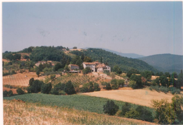
p.v. N.1. Vista da sud-est: della villa si percepisce solo la macchia di verde del giardino