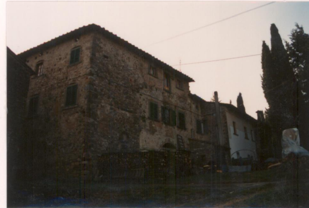
p.v. N.3. Prospetto nord