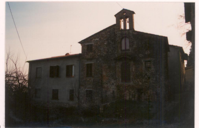
p.v. N.4. La ex cappella inglobata in edifici alterati