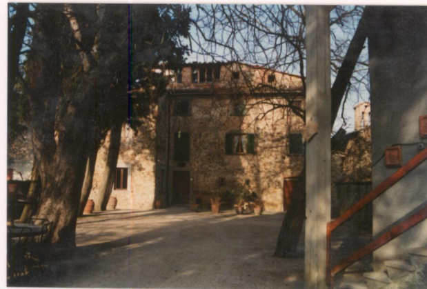
p.v. N.2. Prospetto sud