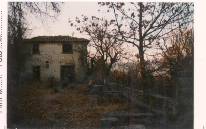
Film 8.A.n. Foto 2.2