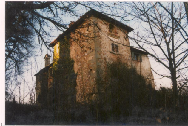
Film 8.A.n. Foto 2.3