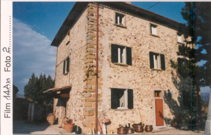
Film 14A4x Foto 2