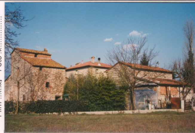
Film 14A4x Foto 5