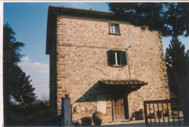
Film 14A4x Foto 4