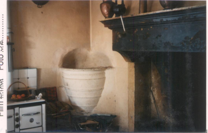
p.v. N. 8