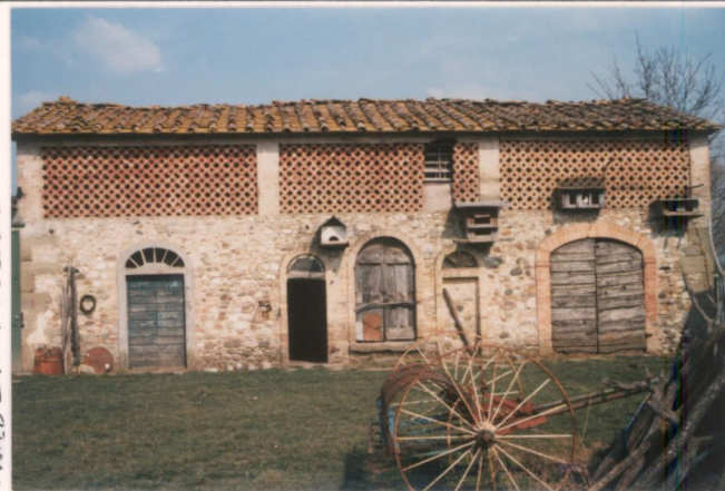
p.v. N. 9