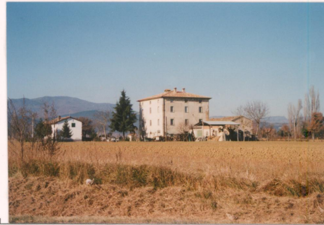
p.v. N. 1. Vista dallo stradone Anghiari-S. Sepolcro