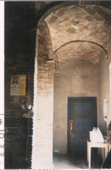
p.v. N. 7