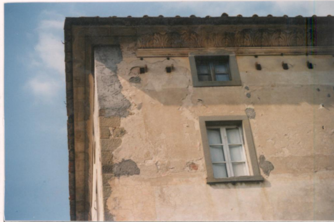
p.v. N. 5