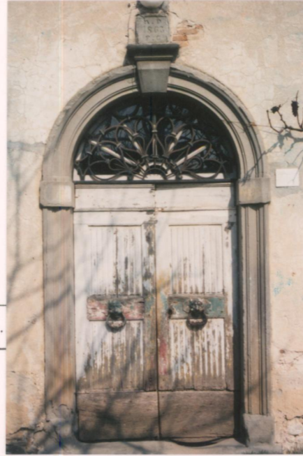
p.v. N. 6