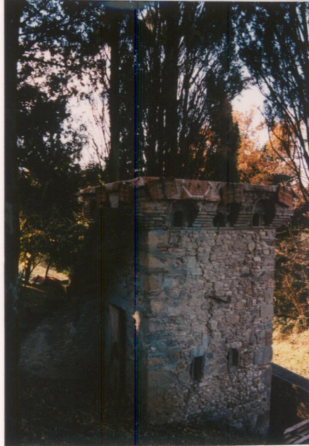
Film 692 Foto 15A