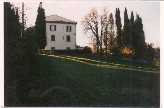
Film 692 Foto 17A