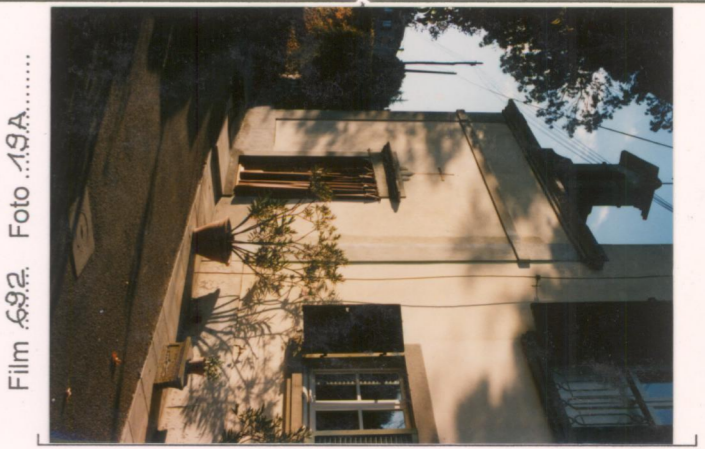
Film 692. Foto 19A..... p.v. N.4. La cappella.....