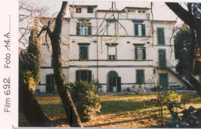
Film 692 Foto 14A