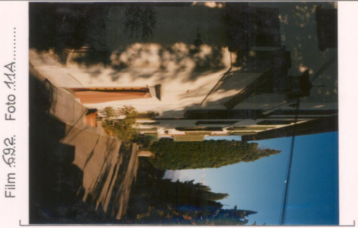
Film 692. Foto 11A..... p.v. N.3. Scorcio del fronte sud-est.....