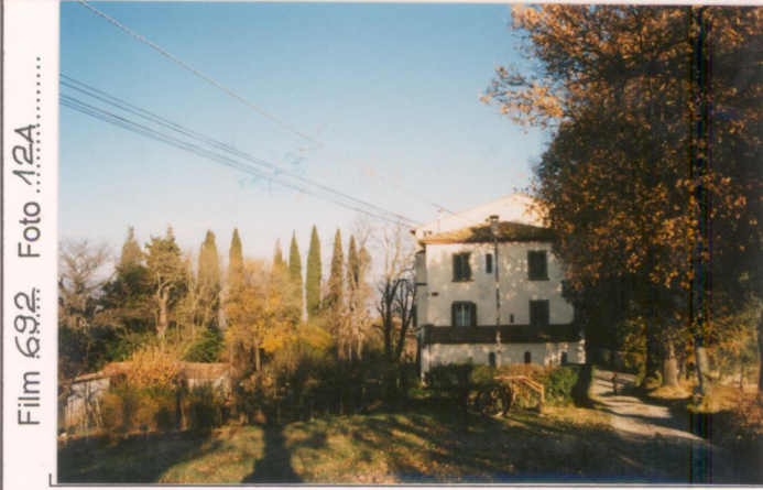
Film 692 Foto 12A