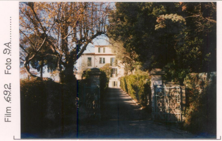
Film 692. Foto 9A..... p.v. N.2. Idem.....