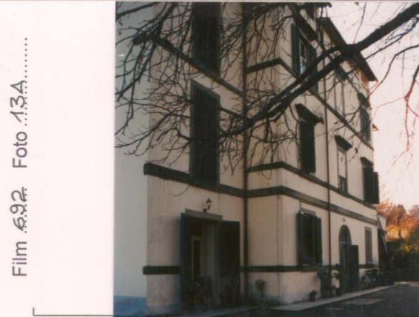
Film 692 Foto 13A