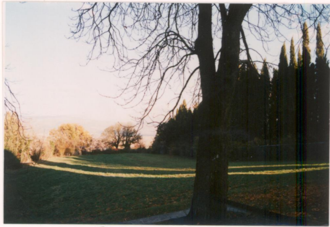
Film 692 Foto 18A