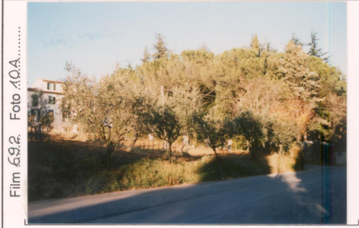
Film 692. Foto 10A..... p.v. N.1. Dalla strada nuova di Anghiari.....