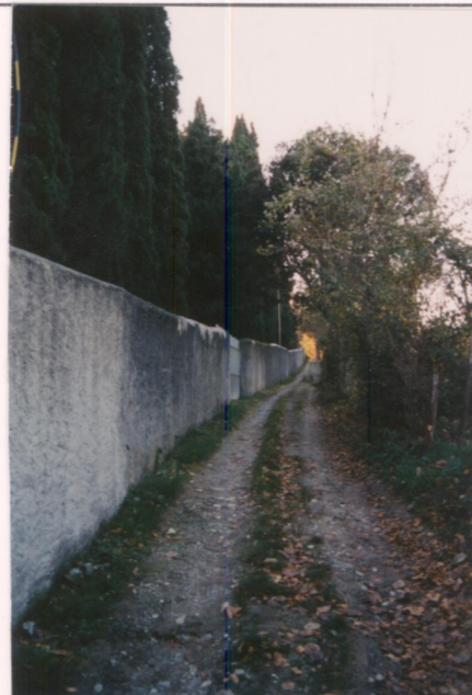
Film 692 Foto 23A