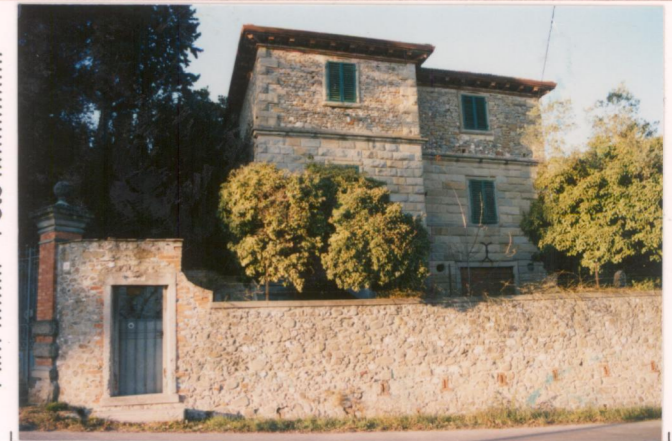
p.v. N. l'abitazione del casiere