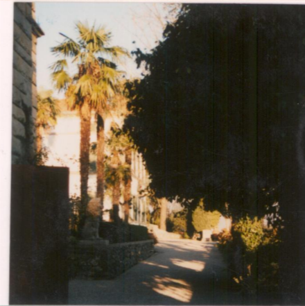
p.v. N. Uno scorcio del giardino