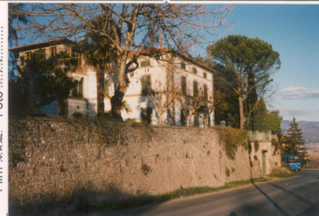
p.v. N.4. Dalla "Via Nova" di Anghiari