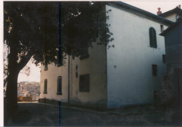
p.v. N. Il retro della villa