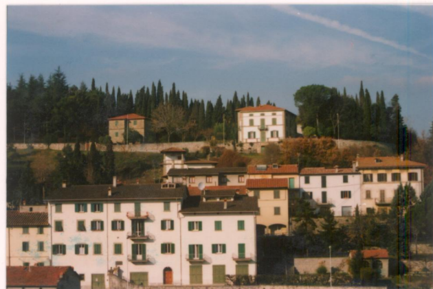
p.v. N.1. Dal terrazzo sulle mura di Anghiari