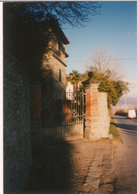
Film 692 Foto 20A