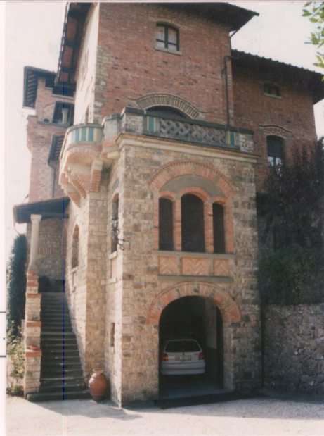
p.v. N. 6.....