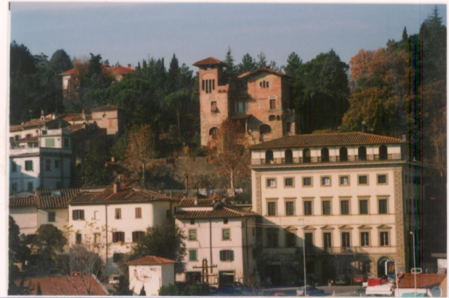
p.v. N. 1 Dal terrazzo sulle mura di Anghiari.