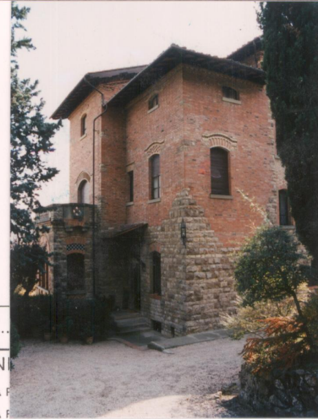
p.v. N. 7.....