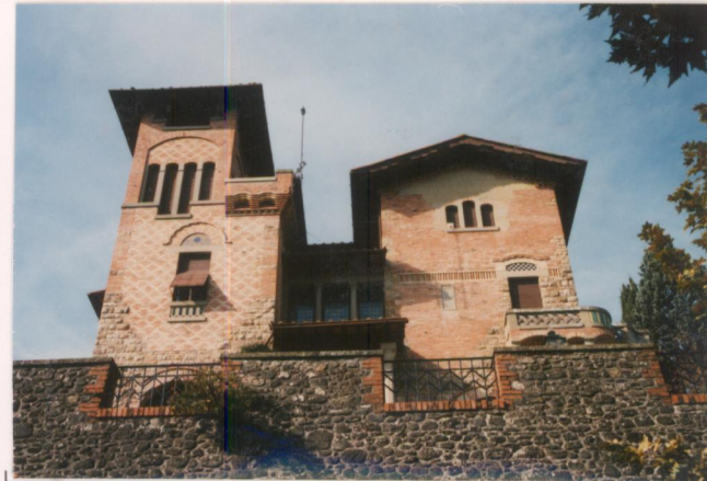
p.v. N. 2