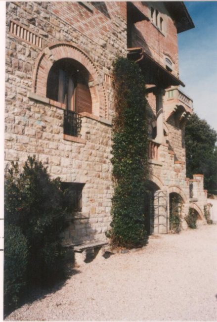
p.v. N. 5.....