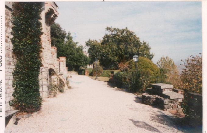
p.v. N. 4 Uno scorcio del giardino antistante la villa