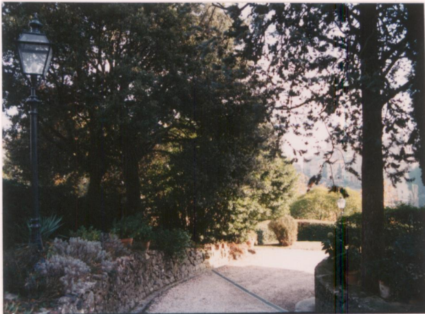
Film 694 Foto 9