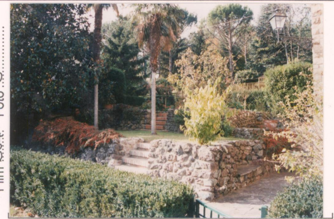
p.v. N. 8. I muretti del giardino sono realizzati in blocchi di pietra di litica del Monte Rufico