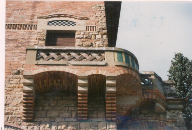
p.v. N. 3