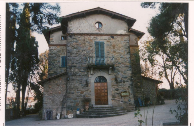
p.v. N. 4 Fronte nord