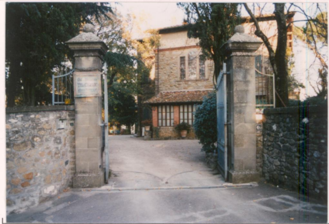
p.v. N. 1