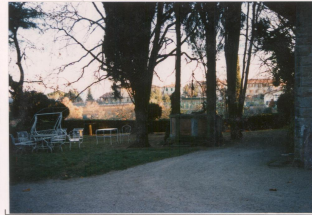
p.v. N. 6 Fusto di sequoia secolare