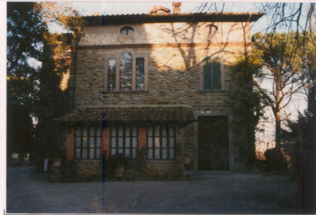
p.v. N. 2 Fronte ovest