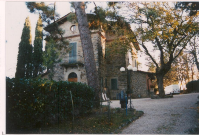
p.v. N. 3