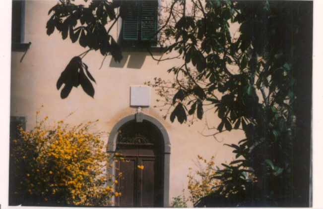
p.v. N.4. L'ingresso alla villa dal cancello.