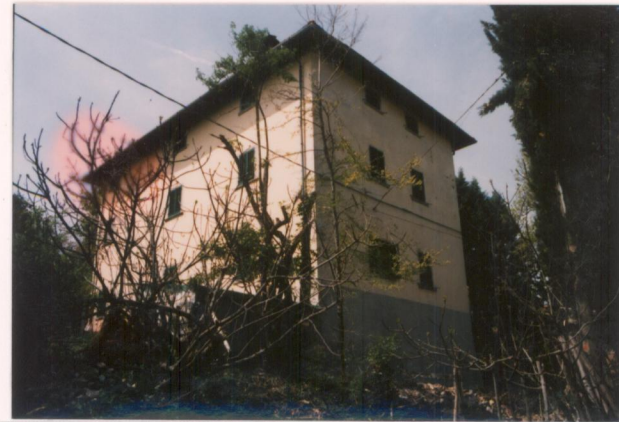
p.v. N.3. Fronti sud-est e nord-est