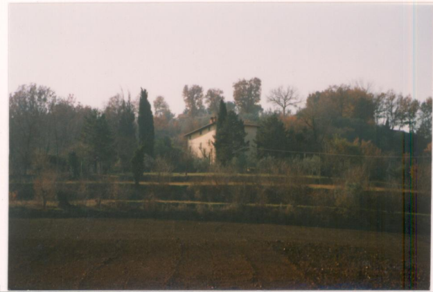
p.v. N.1. Vista dalla strada Anghiari-S.Leo...