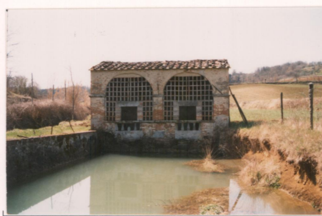
p.v. N. La peschiera