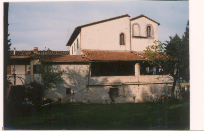
p.v. N. Il fronte sud-ovest