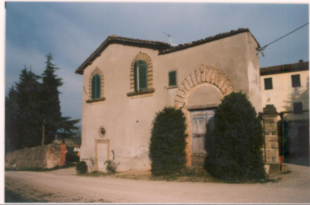
p.v. N. Il fronte su strada