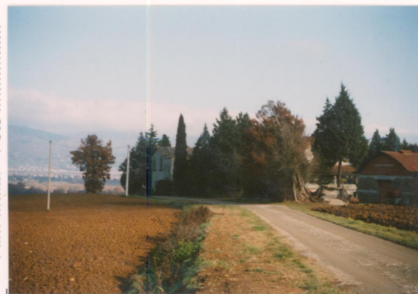
Film 6.9.8. Foto 3.2A.....