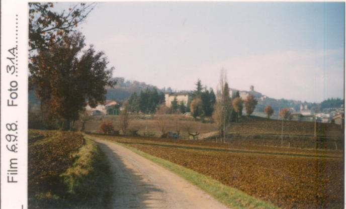
Film 6.9.8. Foto 3.1A.....