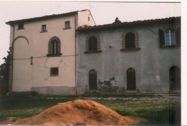
p.v. N. Il fronte nord-est