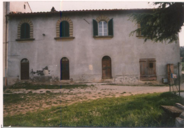
p.v. N. Idem