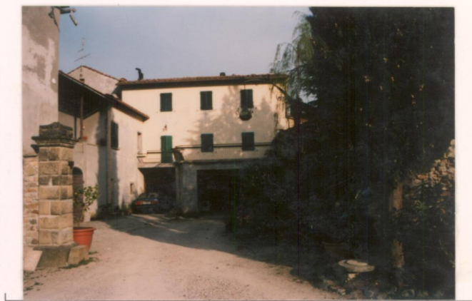
p.v. N. Il prospetto nella corte interna