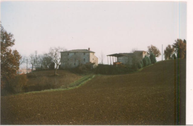
p.v. N. La casa colonica