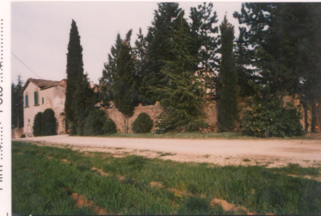
Film 56.4.9. Foto 4.5.....