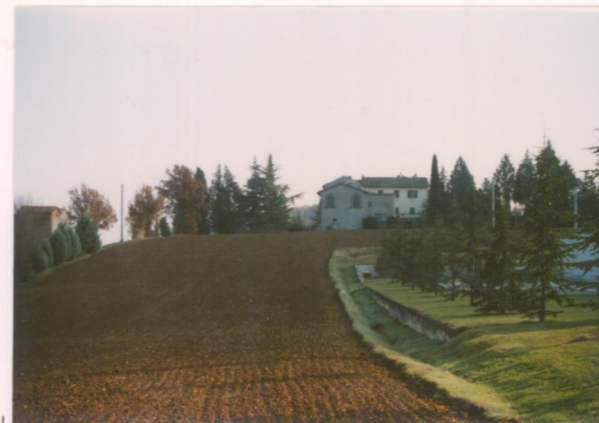
Film 6.9.8. Foto 3.3A.....