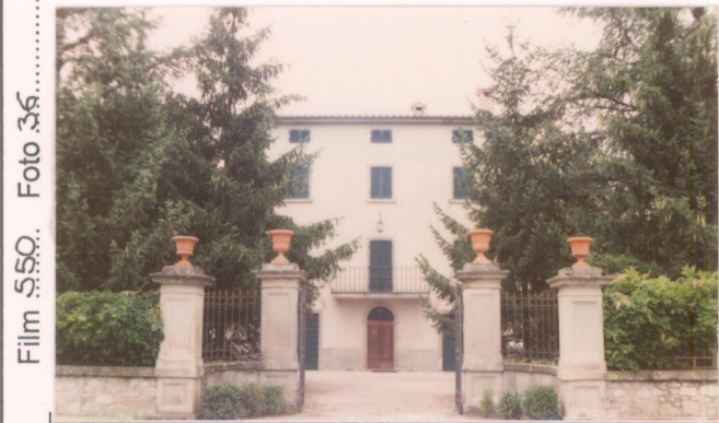
Film 550. Foto 36.