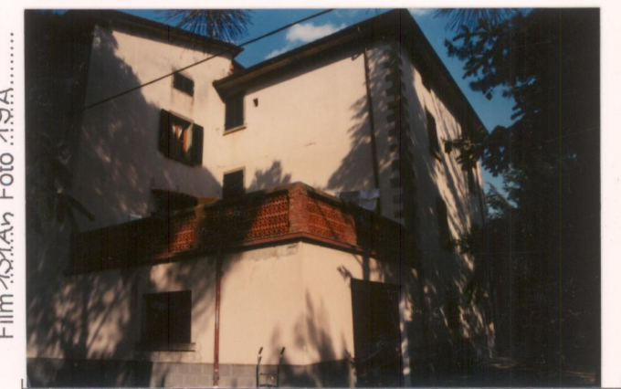
Film 131A. Foto 19A.