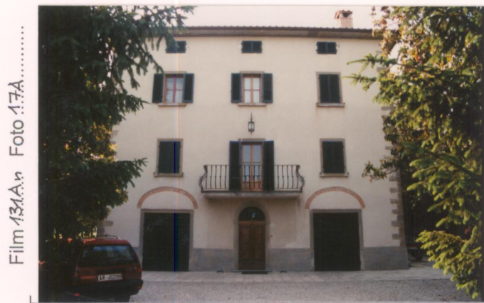
Film 131A. Foto 17A.