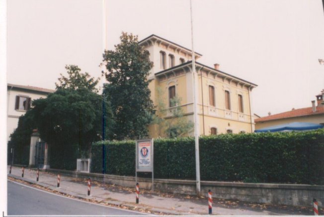
Film 704. Foto 3. p.v. N. 2.