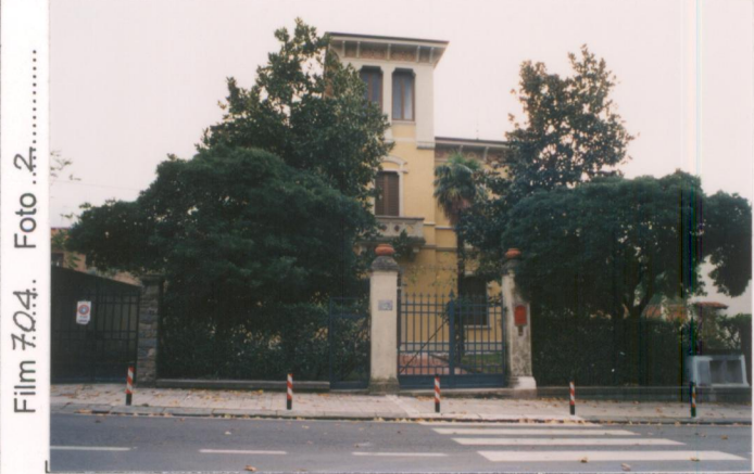
Film 704. Foto 2. p.v. N. 1.