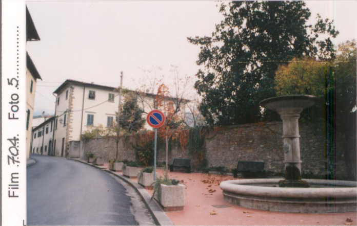
Film 704. Foto 5. p.v. N. 1