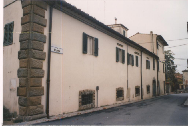
Film 704. Foto 6. p.v. N. 2