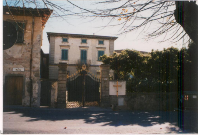
p.v. N. 1. Fronte su via Roma