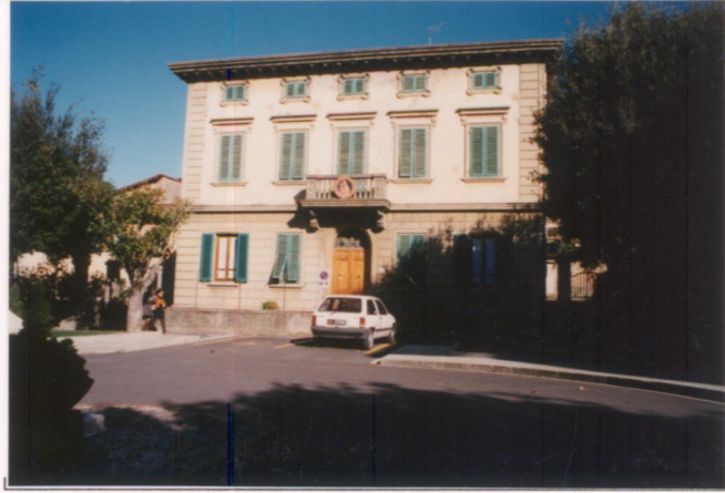
p.v. N. 2. Fronte su Piazza del Comune