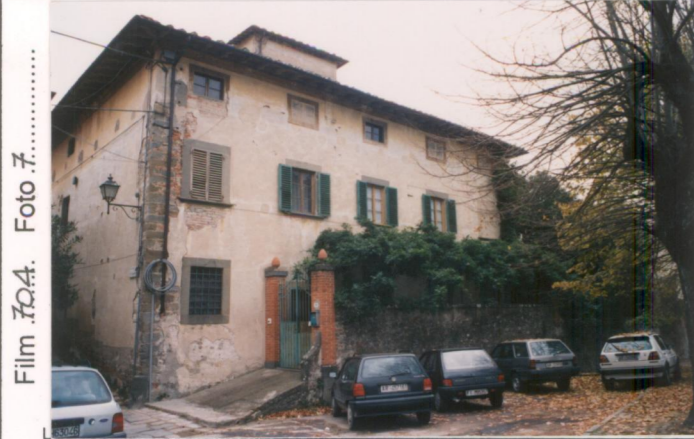
Film 704. Foto 7. p.v. N. 1. Fronte su Via Roma