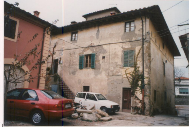
Film 704. Foto 8. p.v. N. 2. Retro