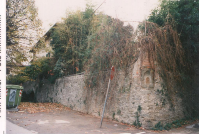
Film 704. Foto 9. p.v. N. 3. Il giardino lungo via Roma