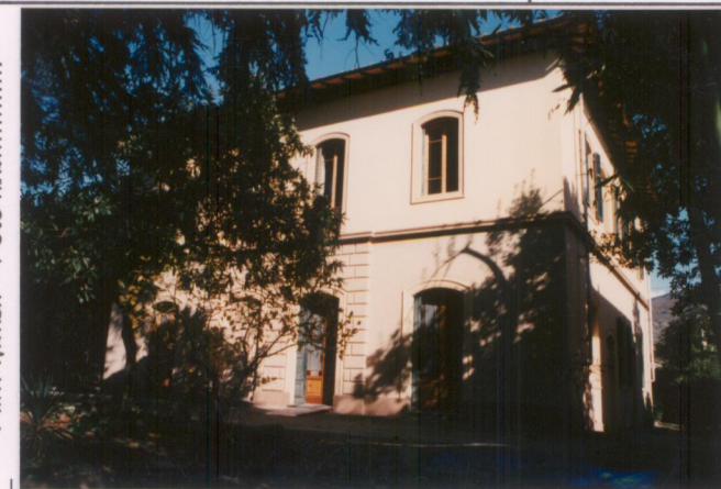
Film 705. Foto 13