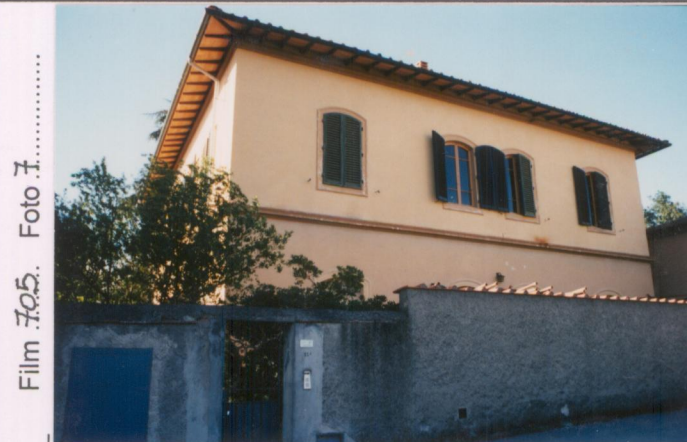
Film 705. Foto 7.....