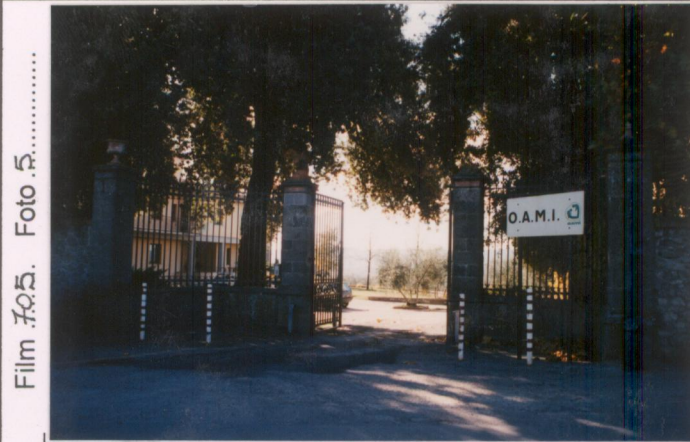
Film 705. Foto 5.....