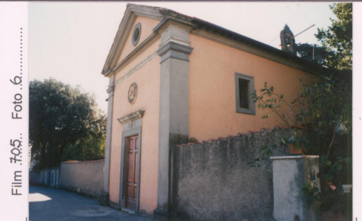
Film 705. Foto 6.....