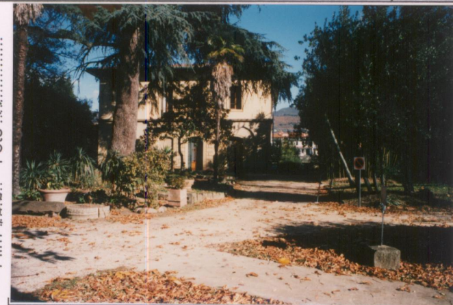
Film 705. Foto 11