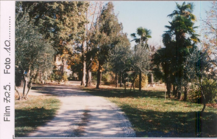
Film 705. Foto 10