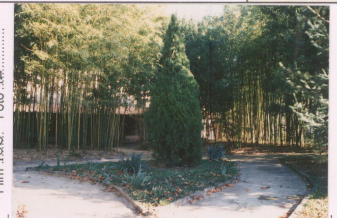
Film 705. Foto 12