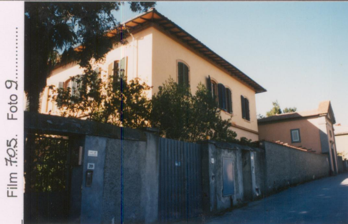
Film 705. Foto 9.....