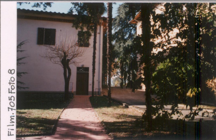
Film 705 Foto 8