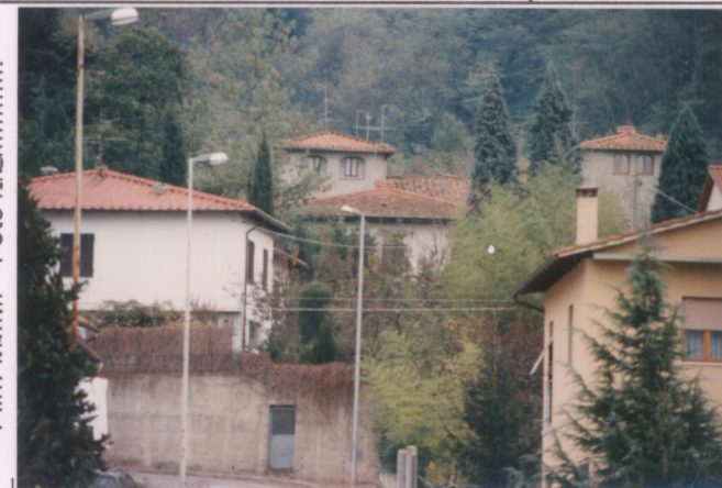
Film 704. Foto 18