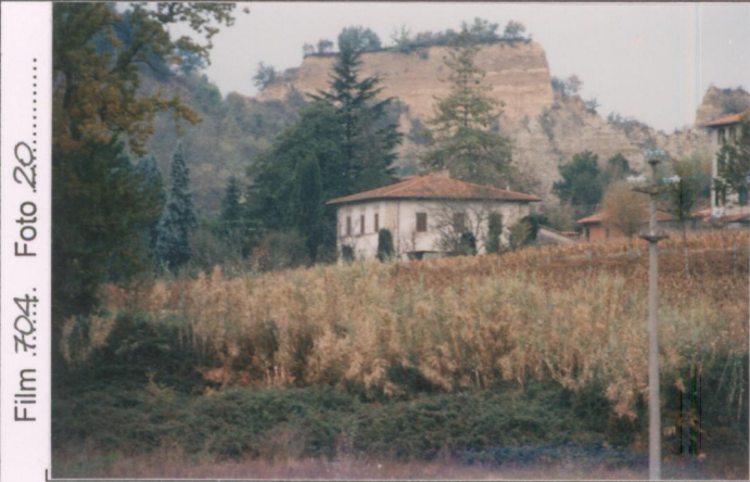
Film 704. Foto 20