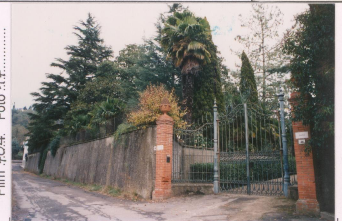
Film 704. Foto 17