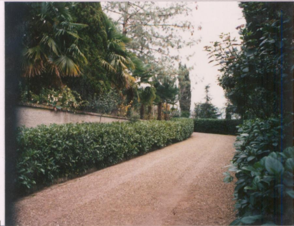
p.v. N. 5 Viale di accesso alla villa.....