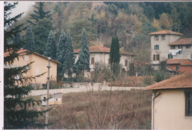
Film 704. Foto 19