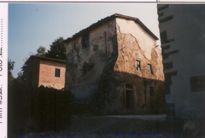
p.v. N. 4. Edifici annessi (retro)