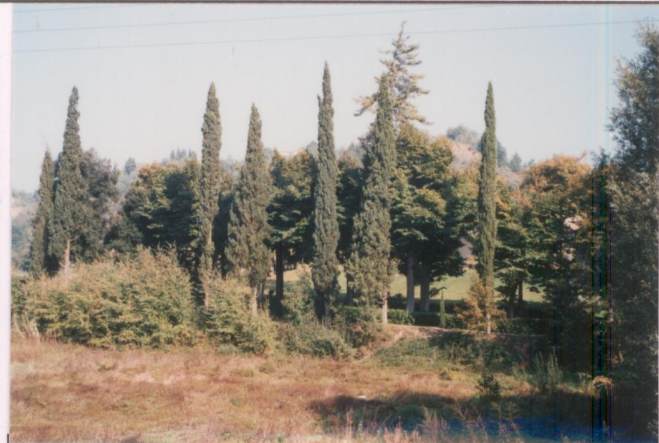
p.v. N. 1. Veduta dalla provinciale