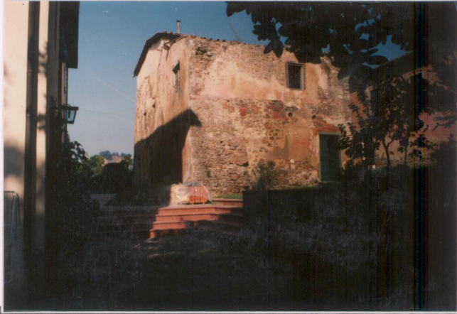
p.v. N. 5. Ammessi.....