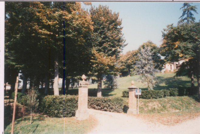
p.v. N. 2. Viale di accesso