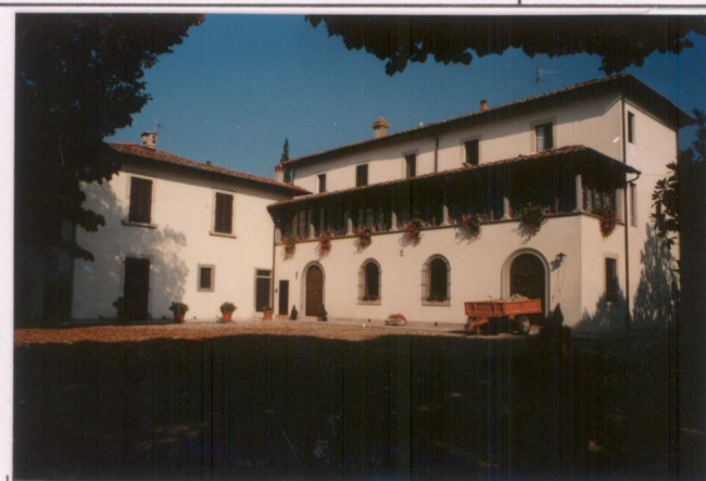
p.v. N. 3. Villa