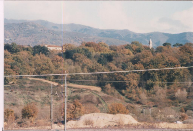
Film 705. Foto 15.....