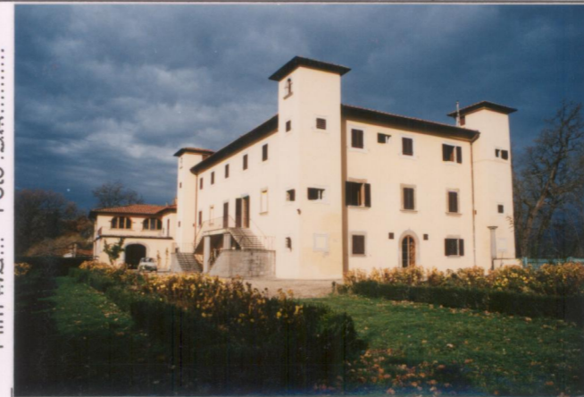
Film 45... Foto 9A.....