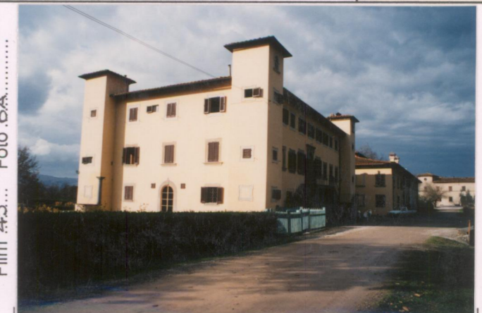
Film 45... Foto 6A.....