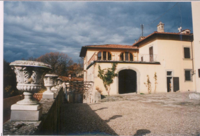
p.v. N. ....