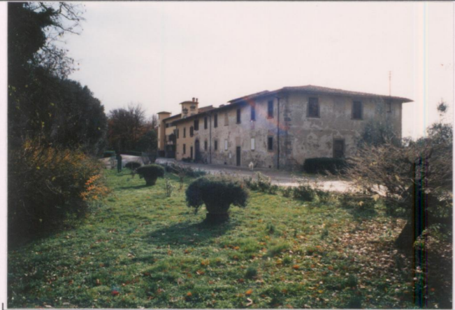
p.v. N. ....