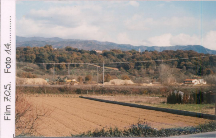
Film 705. Foto 14.....