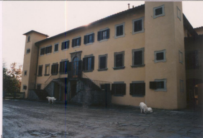
p.v. N. ....