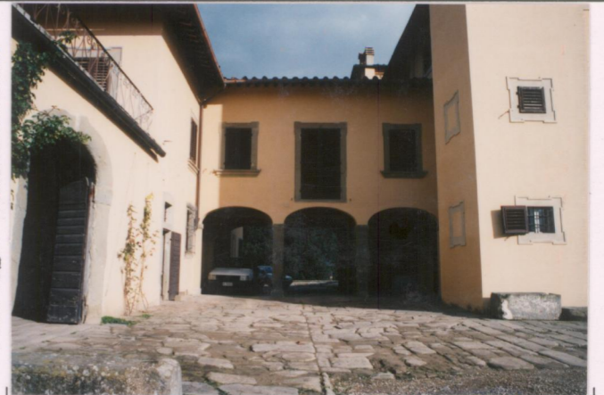
p.v. N. ....