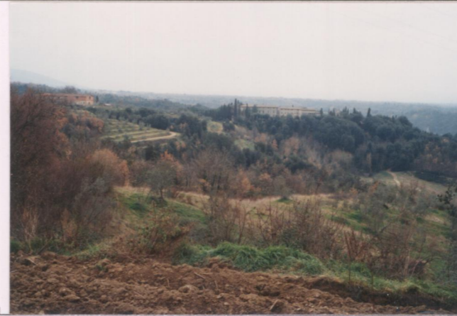
p.v. N. 3. Veduta dalla "Sette ponti"