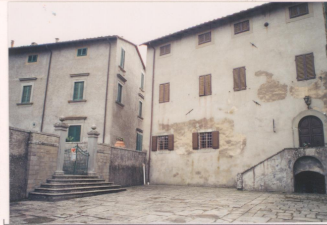
Film 122. Foto 23