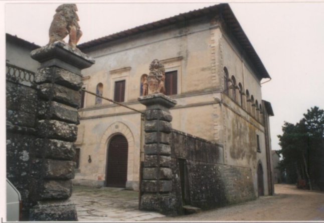
Film 122. Foto 22