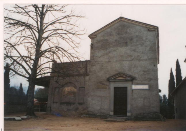
Film ..... Foto .....