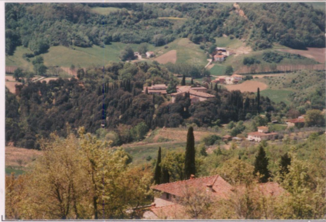
p.v. N. 2. Veduta da Querceto