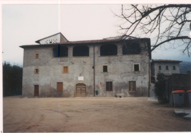
Film ..... Foto .....