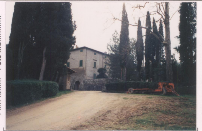
p.v. N. 4. Ingresso