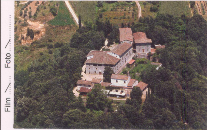
p.v. N. 1. Foto aerea