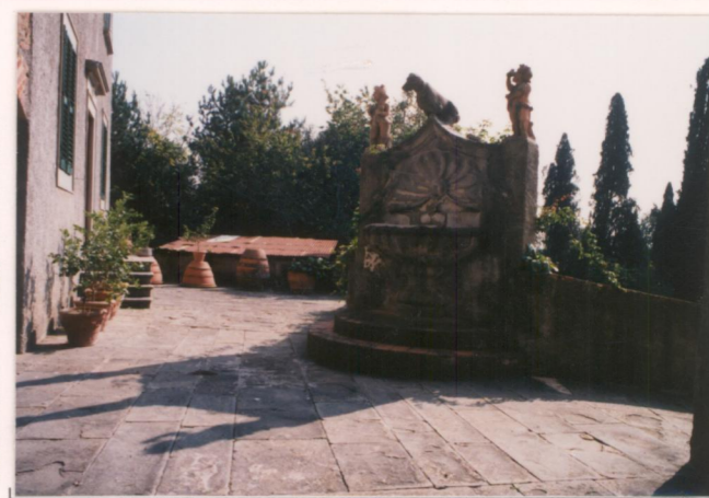
Film ..... Foto .....