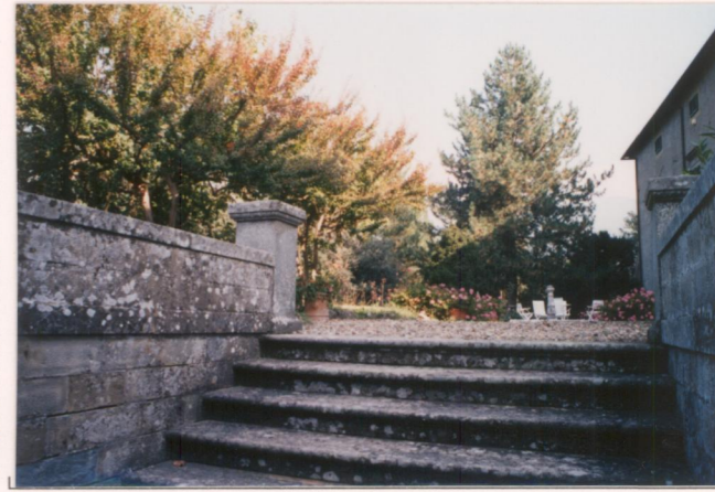
Film ..... Foto .....