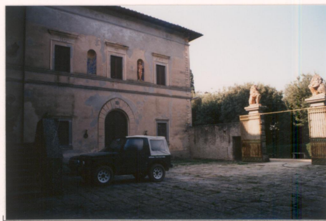
Film ..... Foto .....