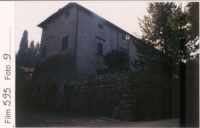
Film 595. Foto 9