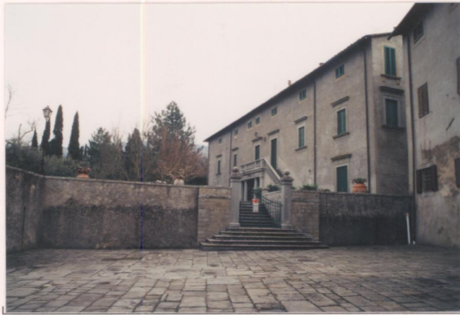
Film ..... Foto .....