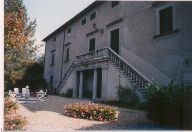
Film ..... Foto .....