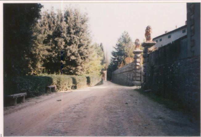
Film 595. Foto 7