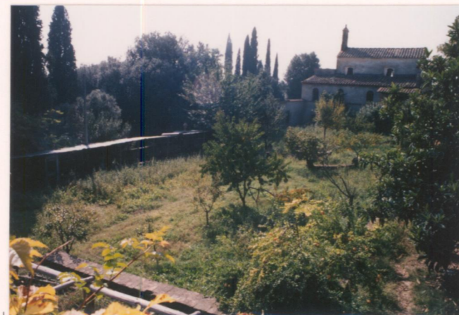
Film ..... Foto .....