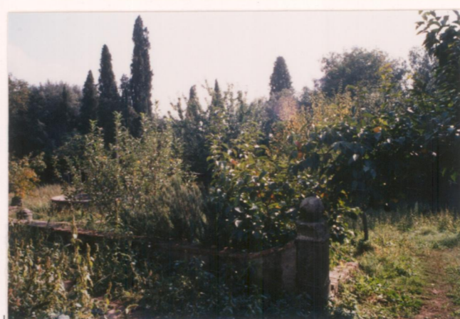
Film ..... Foto .....