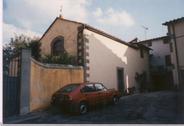
p.v. N. 3. Cappella