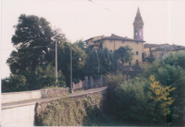
p.v. N. 1. Veduta dalla strada di Piantravigne