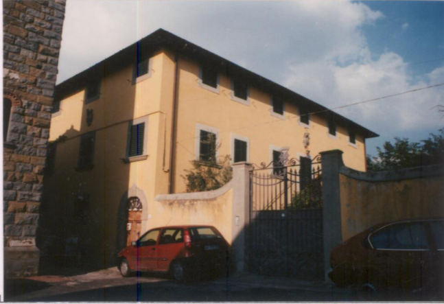
p.v. N. 2