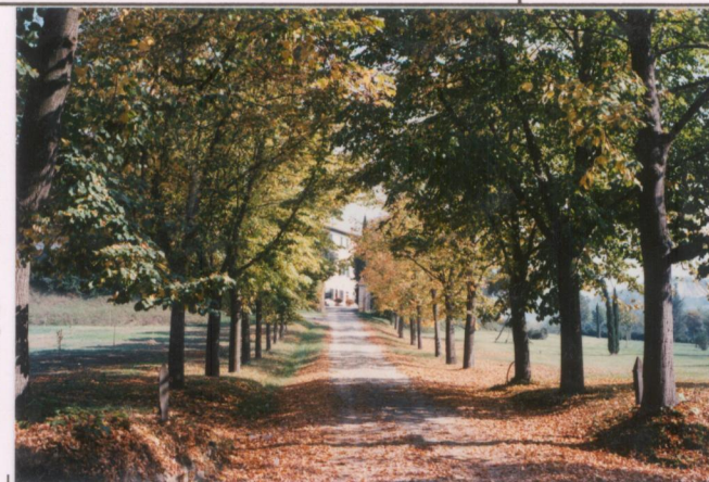
p.v. N. 3...Viale di accesso.....