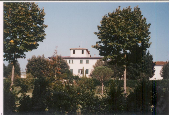
p.v. N. 1...Veduta dalla strada provinciale...