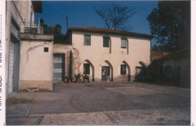
p.v. N. 4. Annessi.....