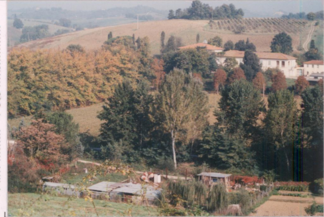
p.v. N. 1. Veduta da Badiola.....