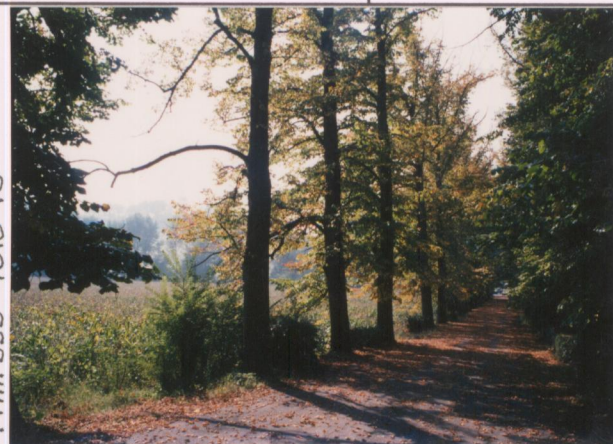
Film 593 Foto 18