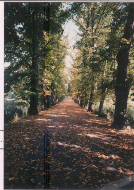
Film 593 Foto 12 p.v.N.6 Viale di accesso