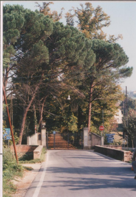
Film 593 Foto 10 p.v.N.5 Ingresso