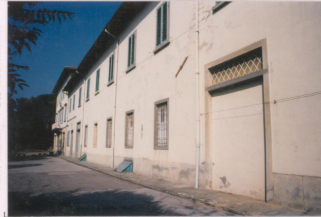
p.v. N. 3. Fattoria.....