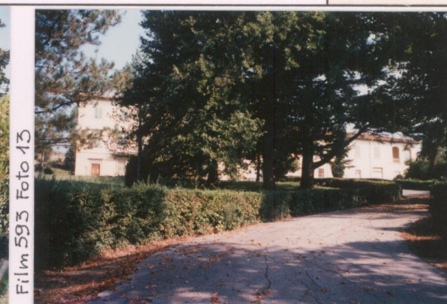
Film 593 Foto 13