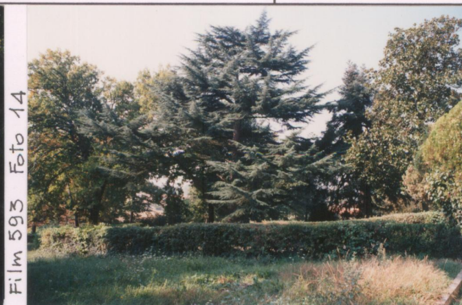
Film 593 Foto 14