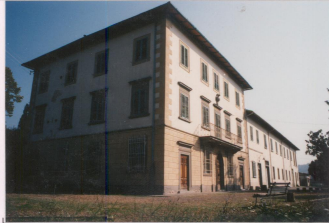
p.v. N. 2. Villa.....