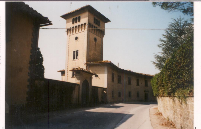
p.v. N. 4...Idem...(da sud.)