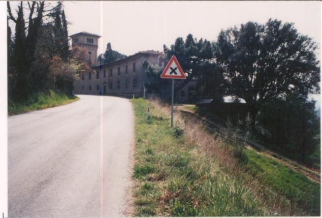
p.v. N. 2...Veduta...dalla...sette ponti.....