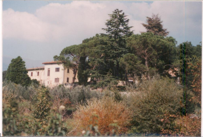
p.v. N. 1...Veduta...dalla strada...di S. Donato