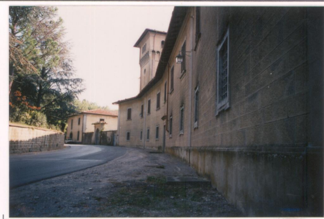
p.v. N. 3...Lungo la...sette ponti...(da nord)