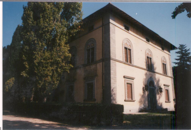
p.v. N. 5. Fronti. a. sud. e. ovest.....