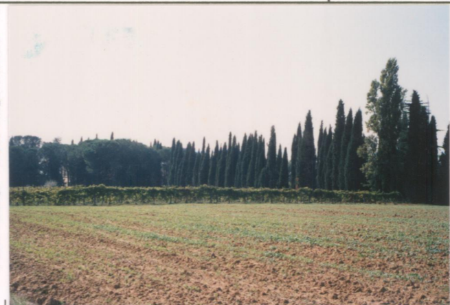
p.v. N. 3. Veduta dalla provinciale a nord-est