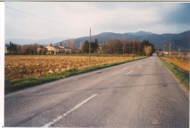
p.v. N. 1. Veduta dalla provinciale a sud-ovest