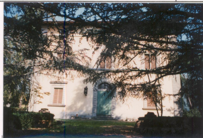
p.v. N. 6. Fronte. sud.....