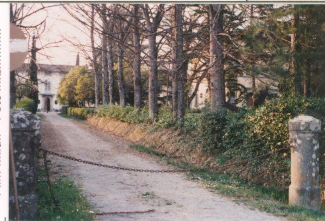
p.v. N. 4. Viale di accesso