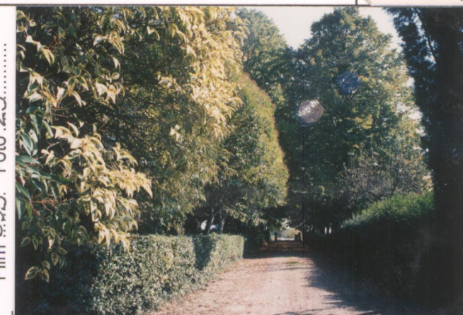
p.v. N. 8. Viale. di. accesso.....