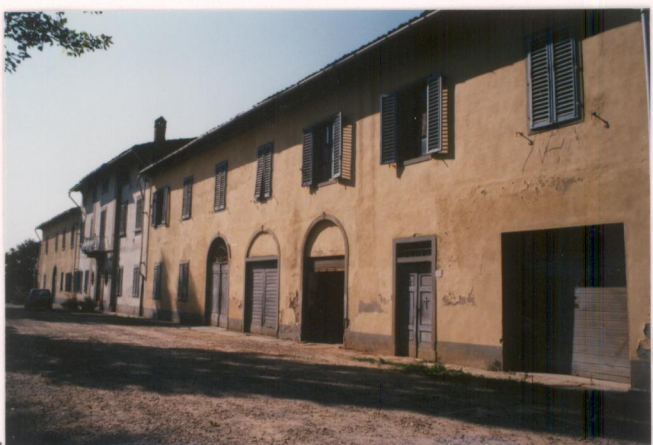
p.v. N. 9. Annessi. sul. retro. della. villa.....