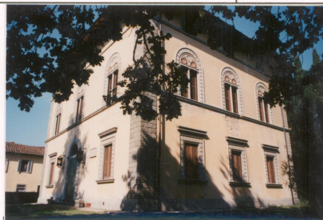
p.v. N. 7. Fronte. est.....