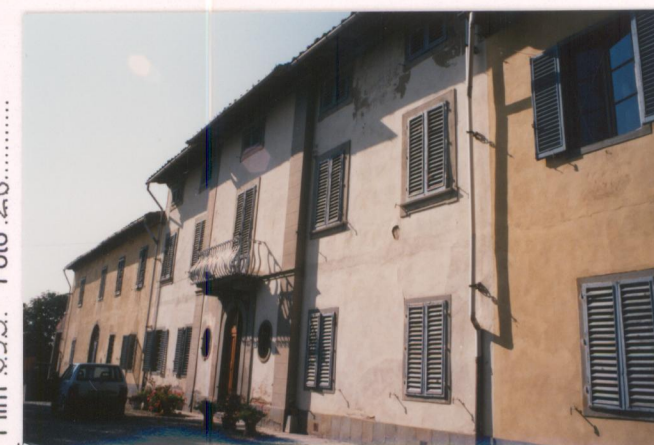
p.v. N. 10. Idem.....