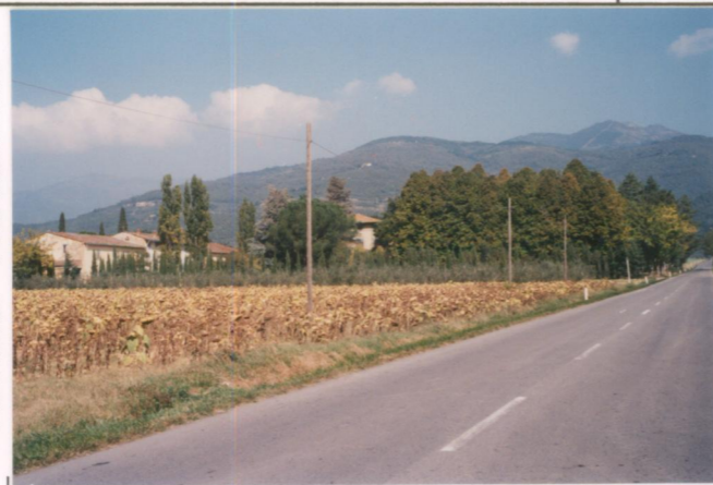
p.v. N. 2. Idem