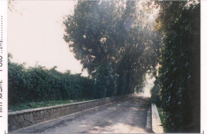
p.v. N. 8...Viale di accesso.....