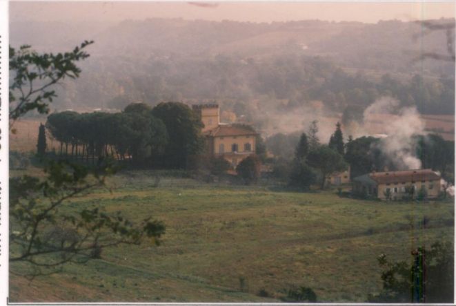
p.v. N. 1. Veduta da Pervina