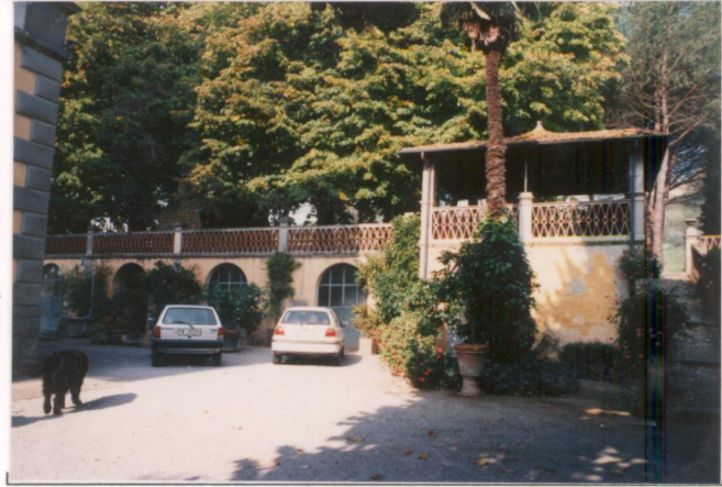
p.v. N. 5...Limonaia.....