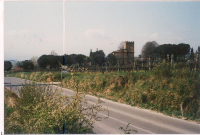
p.v. N. 2. Veduta dalla provinciale (nord)