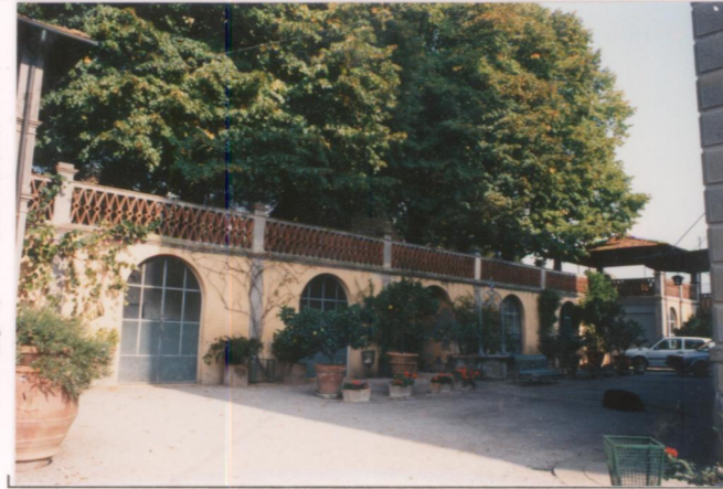
p.v. N. 6...Idem.....