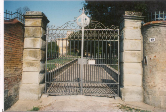
p.v. N. 7...Cancellata.....