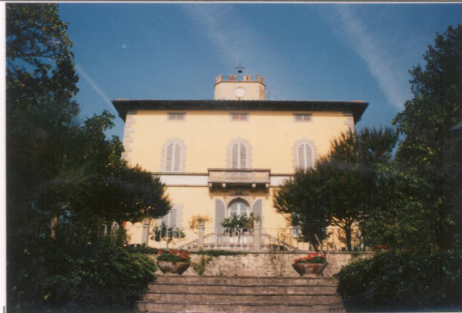
p.v. N. 3