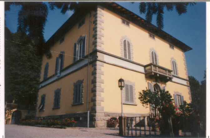
p.v. N. 4