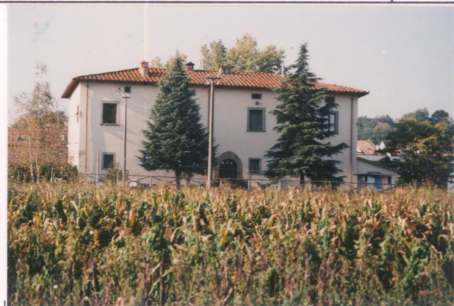
Film 354 Foto 6