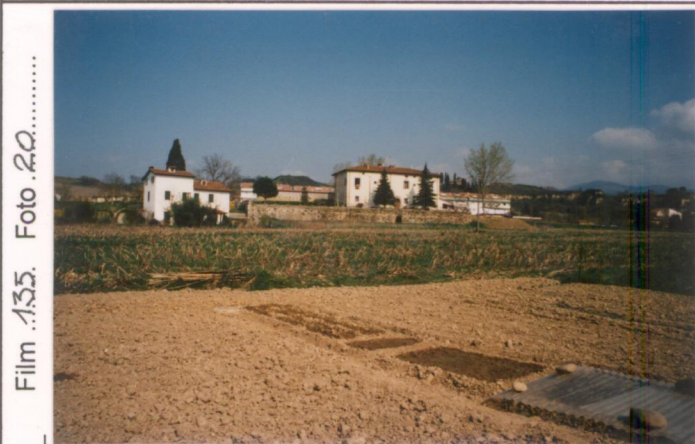
Film 135 Foto 20