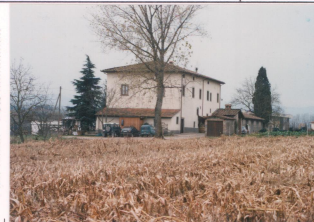
Film 704 Foto 0