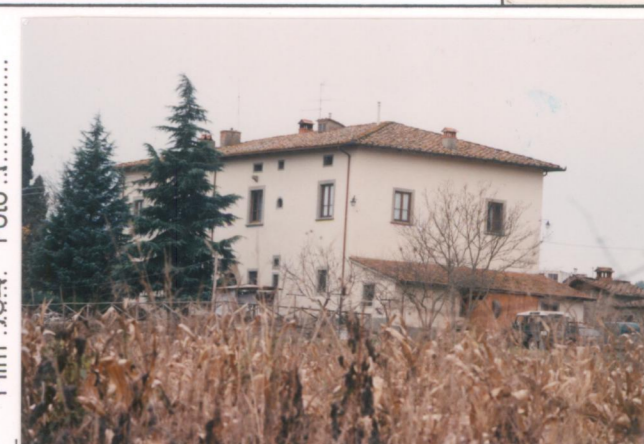
Film 704 Foto 1