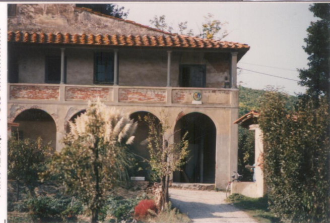
Film 594. Foto 9.....