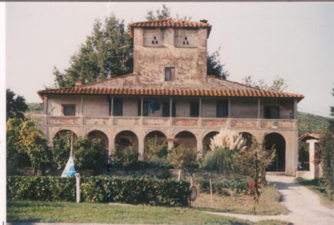
Film 594. Foto 8.....