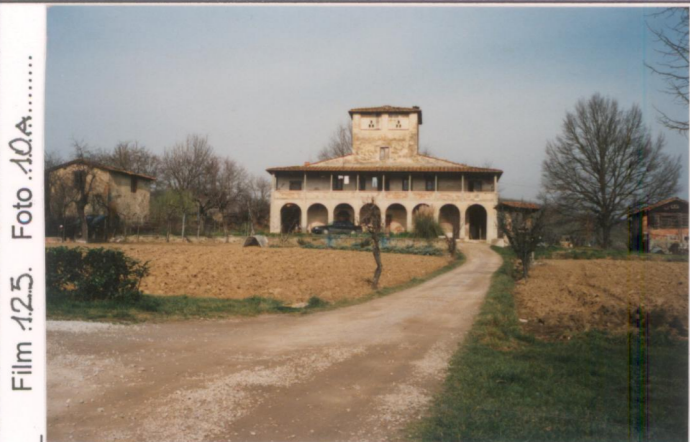
Film 125. Foto 10A.....