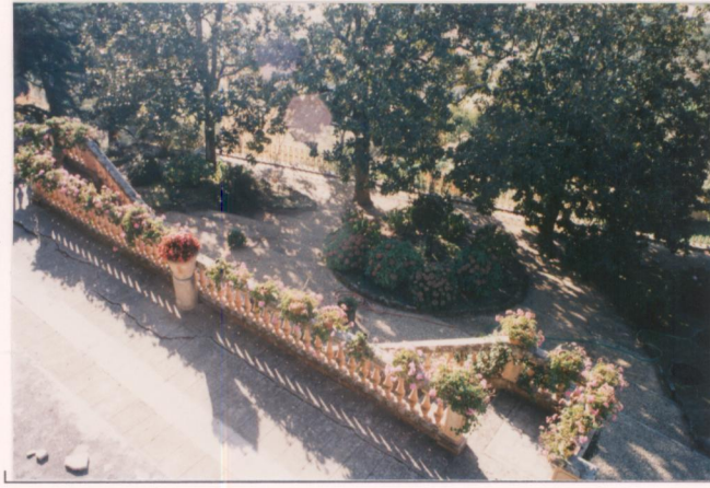
p.v. N. 6. Il giardino sotto la limonaia.....