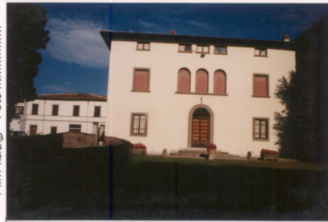
Film 599. Foto 1