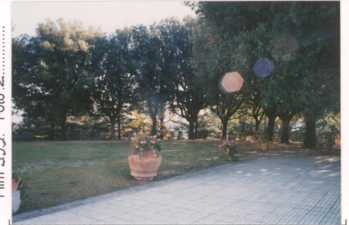
Film 599. Foto 2