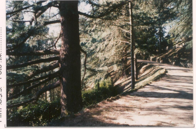
p.v. N. 12. idem.....