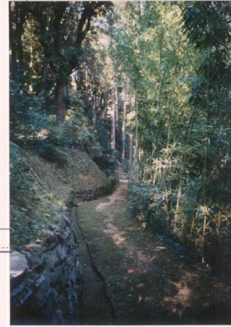
p.v. N. 13.....