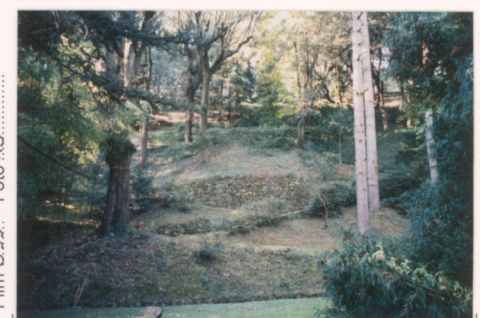
p.v. N. 15. Il bosco sotto la villa visto dal laghetto.....