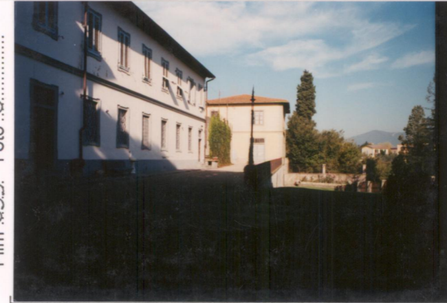
Film 599. Foto 0