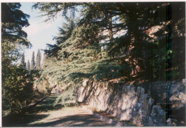
p.v. N. 9. Viale principale verso il giardino.....