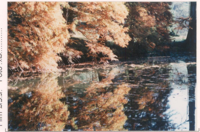
p.v. N. 18. Idem, particolare.....