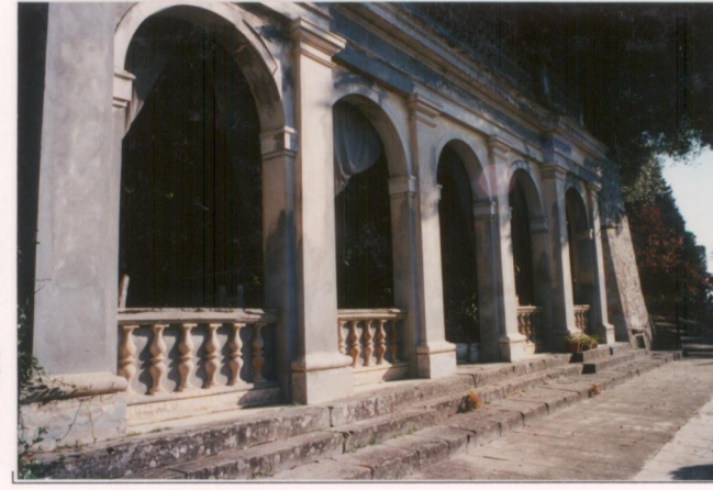
p.v. N. 7. Limonaia.....