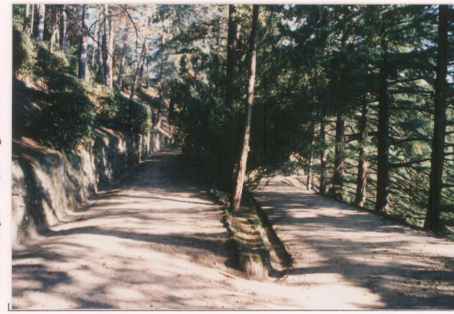
p.v. N. 11. idem.....