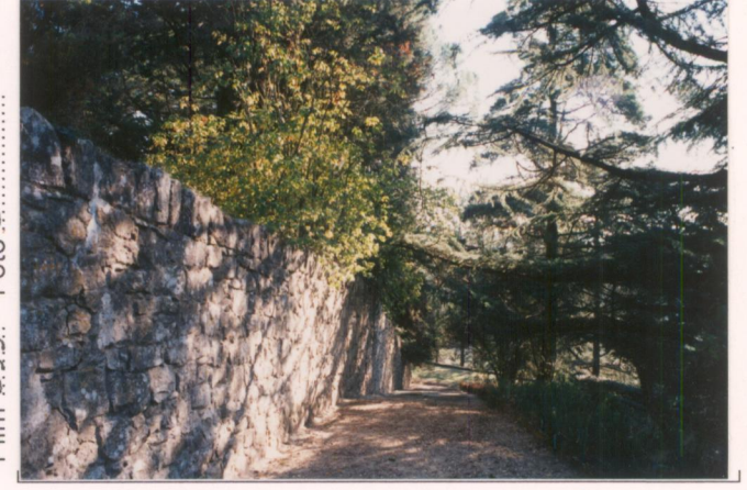
p.v. N. 8. Vialetto vicino alla limonaia.....