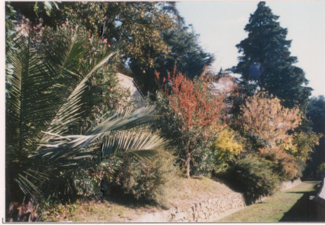
p.v. N. 10. Viale principale verso il laghetto.....