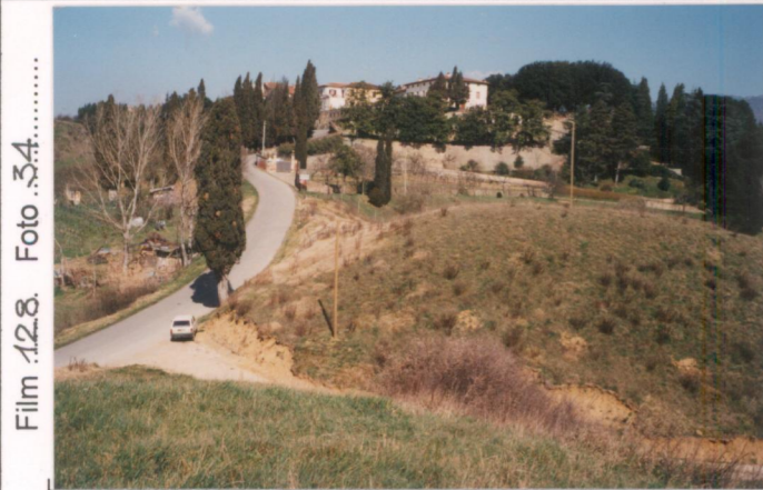
Film 128. Foto 34