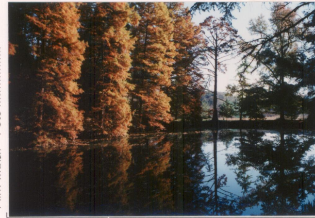
p.v. N. 17. Il "laghetto" e i Taxodium.....