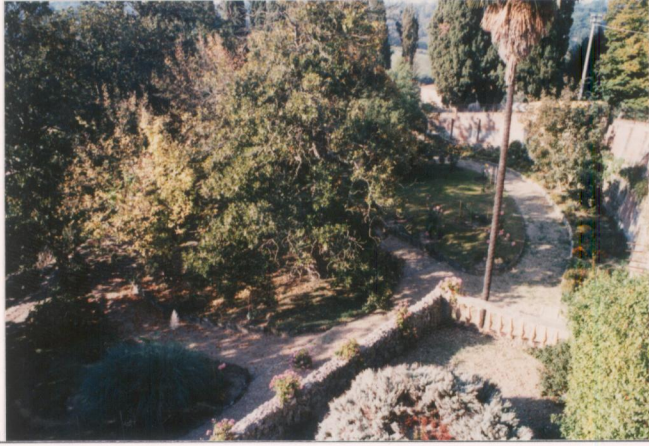
p.v. N. 5. Il giardino a sud della villa.....