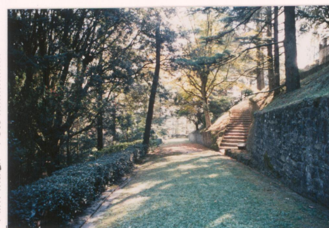
p.v. N. 14. Viale sotto la villa.....