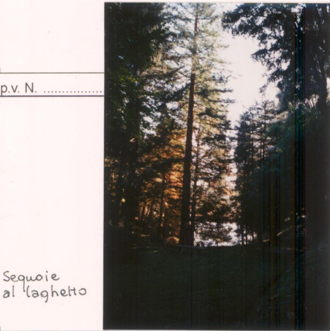
p.v. N. 16.....