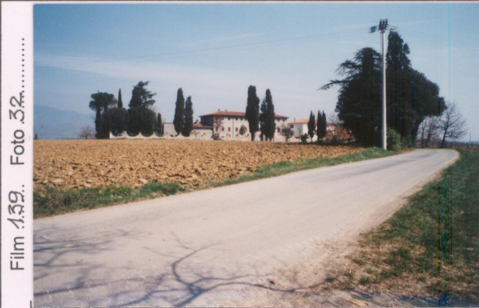
Film 139. Foto 32