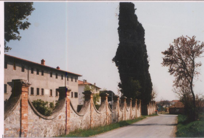
Film 139. Foto 36