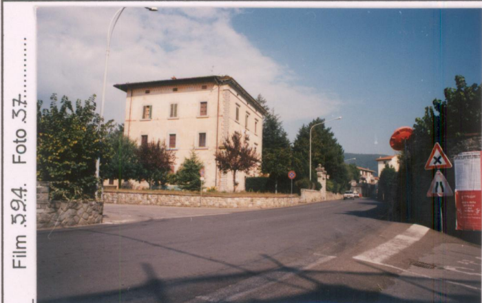
Film 594. Foto 37..... p.v. N. 1...Veduta...da...ovest.....