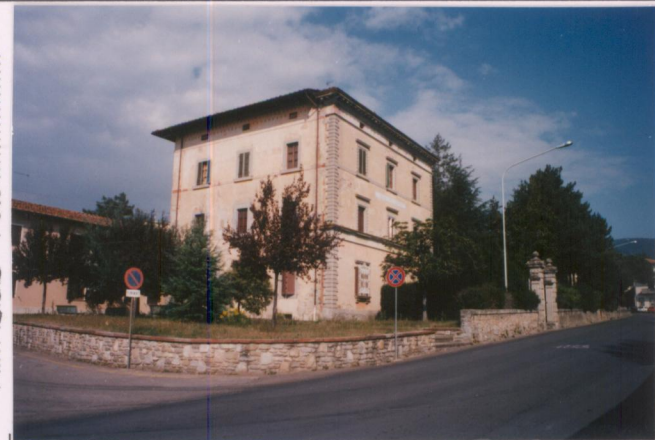
Film 595. Foto 0..... p.v. N. 2.....