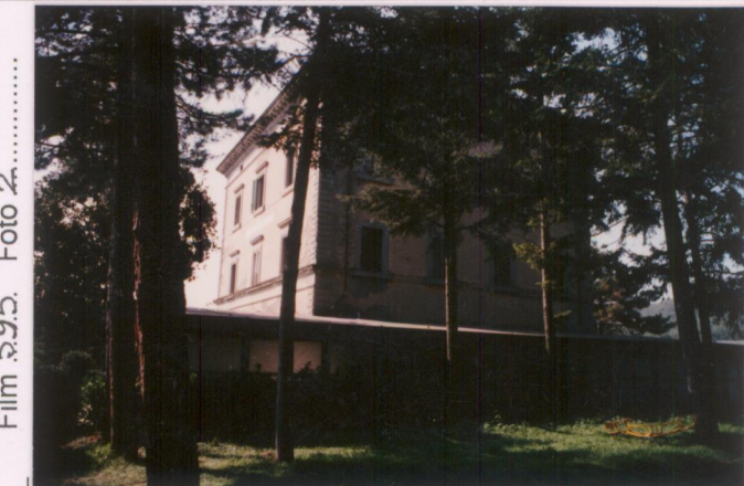
Film 595. Foto 2..... p.v. N. 4 Veduta...dal...giardino...pubblico.....