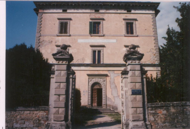
Film 595. Foto 1..... p.v. N. 3.....