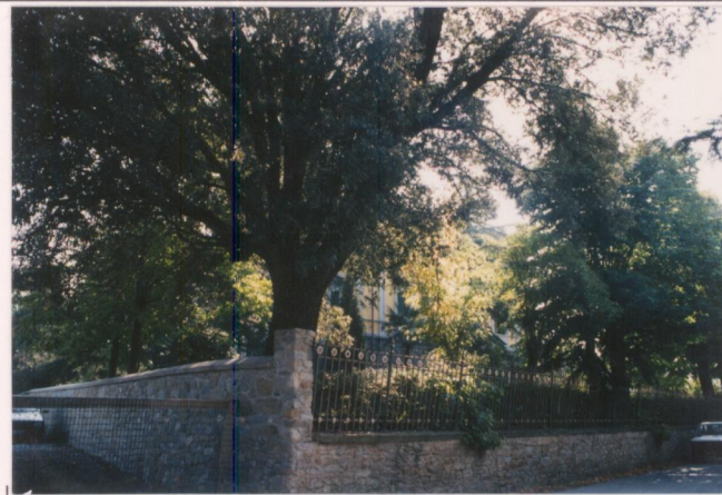
p.v. N. 6 Muro di cinta ad ovest