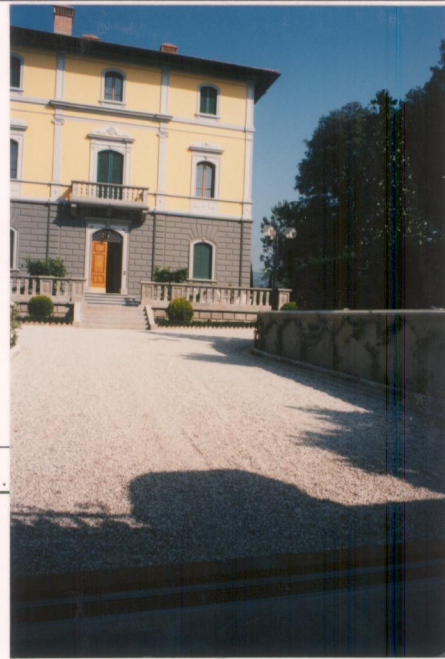
p.v. N. 5