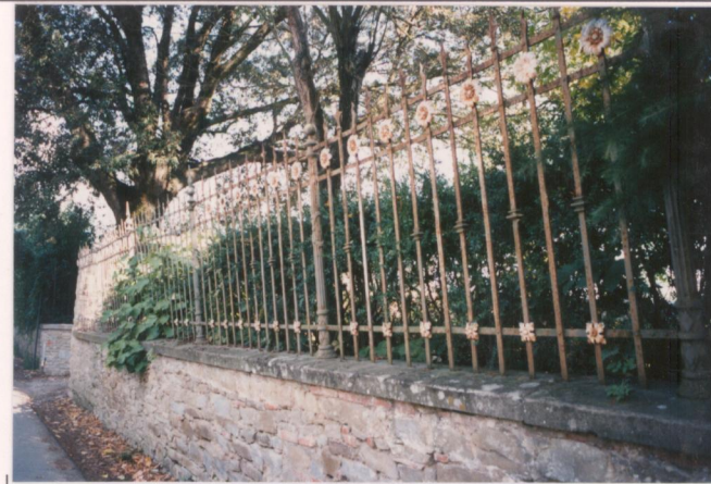
p.v. N. 7 Idem